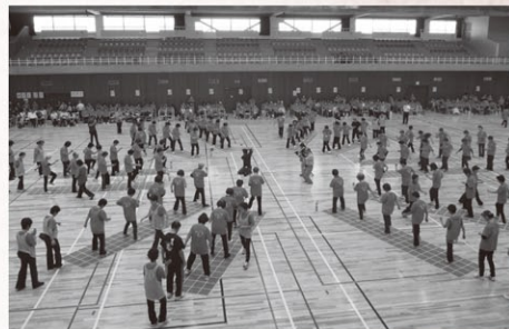
スクエアステップの様子