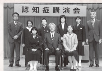
表彰された皆さん

認知症予防啓発標語は、認知症を地域で理解し支えるという目的で募集したところ、854作品の応募があり、標語選考会において中学生の部5作品、一般の部2作品が選ばれました。