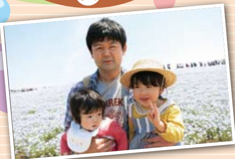
パパと一緒に海浜公園にて！