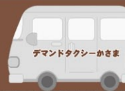
デマンドタクシー利用券