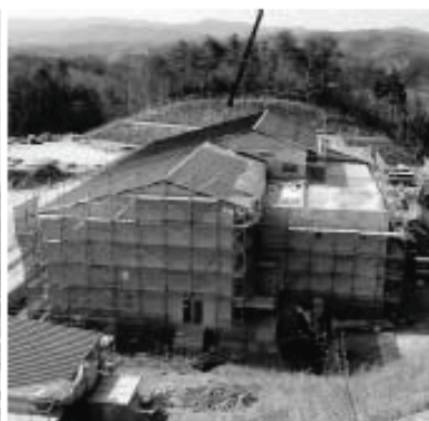
環境学習施設を兼ねた管理棟