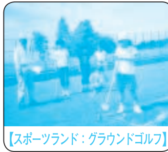
【スポーツランド：グラウンドゴルフ】