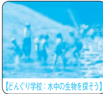
【どんぐり学校：水中の生物を探そう】

なお、詳しい内容や参加申込みについては、学校を通して、児童・生徒に配布するチラシをご覧ください。