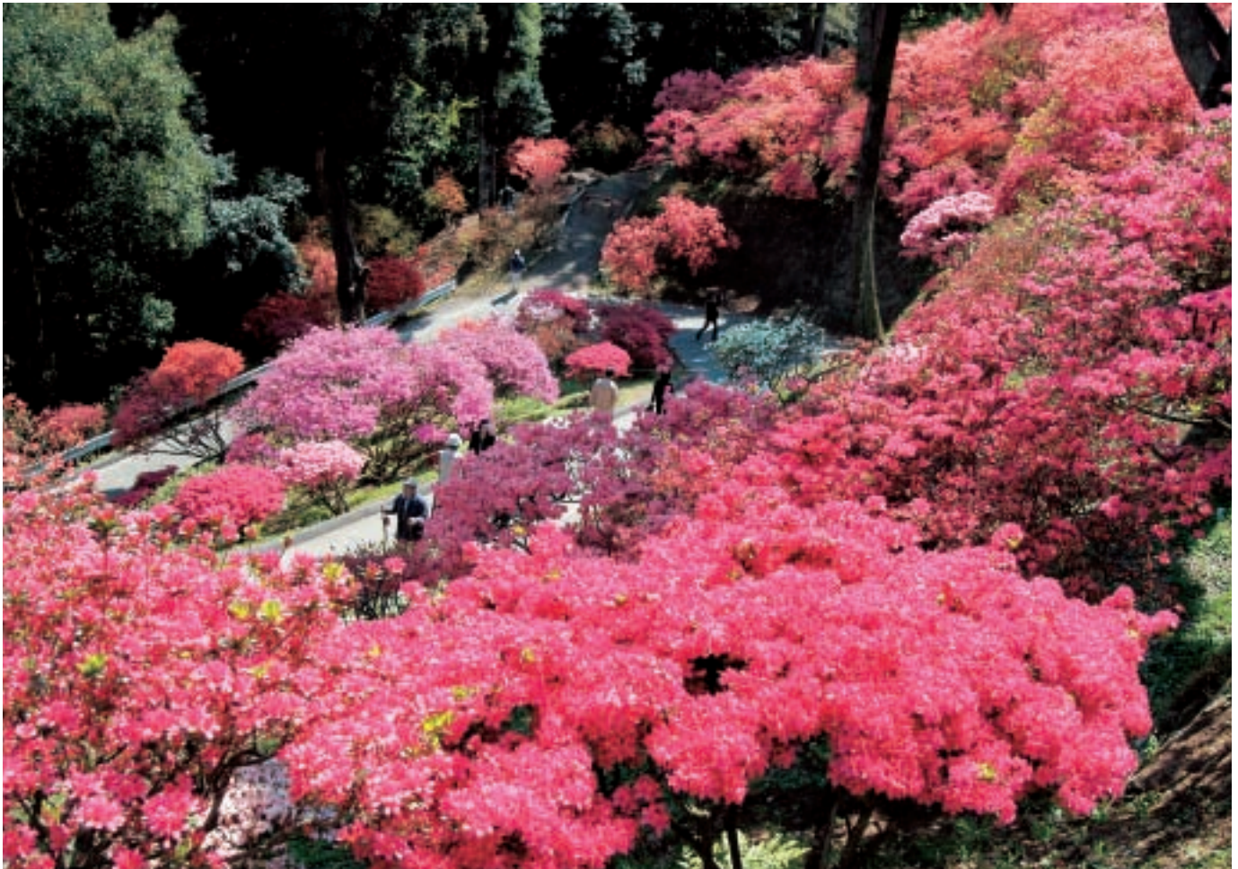
笠間の春を彩る第34回「つつじまつり」