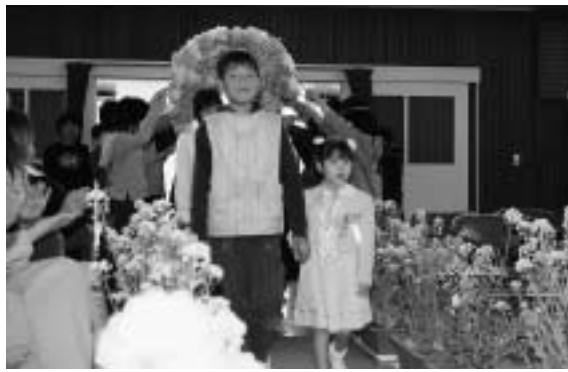
上級生に手を引かれて入場する新入児童

ることは何でもできるように なりましょう ②交通事故に気を付けましょう ③先生のお話をよく聞きましょう の三つの約束を守り、楽しい学校生活を送ることができるよう指導しました。同時に、参列した保護者に対し、優れた人材の育成に向けて、全力を尽くす旨の宣言がなされました。 また、上級生全員が歓迎の歌を披露した後、新入児童に教科書が授与されたほか、茨城中央農業協同組合から黄色い通学帽が贈られました。