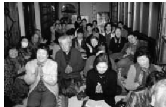
巧みな話術に聴き入るお客さんたち