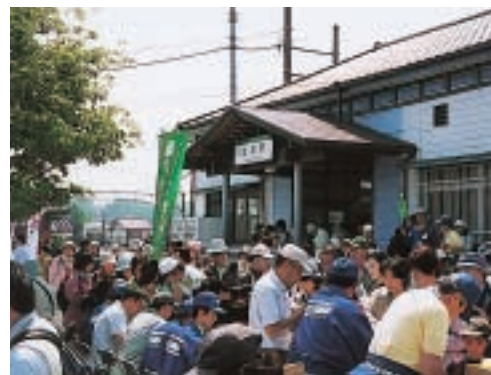
駅前で大勢の観光客を迎える青いユニホームの案内人