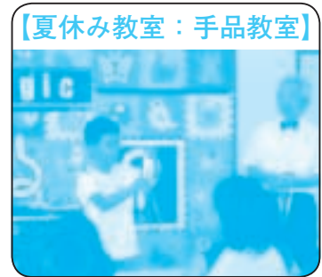
【夏休み教室：手品教室】