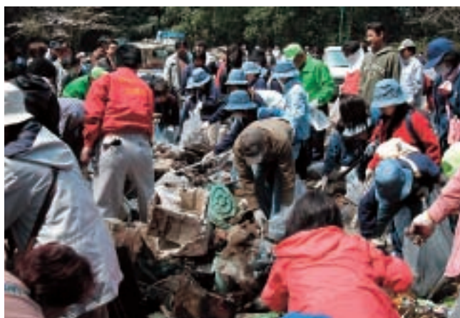
大量のごみを分別する、市民ボランティアの皆さん

「お城山」の名称で市民に親しまれ、笠間市の観光の目玉でもある佐白山。しかし、近年、心無い人たちによる不法投棄が後を絶たず、この山が悲鳴を上げていました。 そこで、「つつじまつり」の開幕を一週間後に控えた4月10日、市民ボランティアによる「佐白山クリーン作戦」（主催▽かさまをよくする市民会議）が行われ、各種団体や家族連れなど387人が参加しました。 山麓公園に集合し、4班に分かれて入山した市民は、道路周辺や谷などをくまなく清掃し、家電製品や粗大ごみ、大量のビン・カン類、可燃ごみなど約4トンを集めた。市のシンボルの大掃除に汗を流しました。