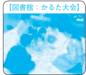
【図書館：かるた大会】