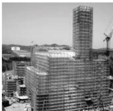
6月から試運転が予定されている溶融炉

また、ハッチョウトンボの生息数は減少したものの、オゼイトンボやシランは生息数・生育数ともに増えている、生息環境は適正に保全されているとの考えが示されました。