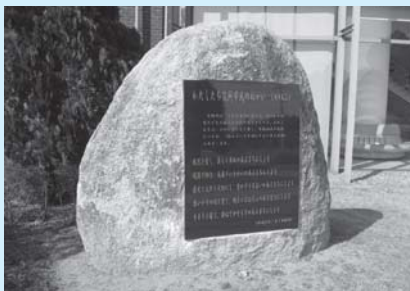
市民センターいわま