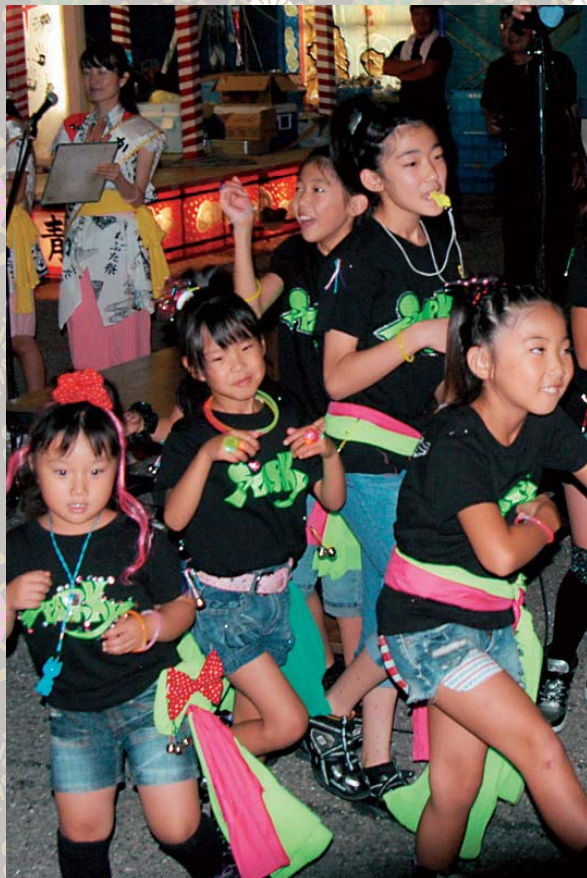
威勢よく掛け声をかけ踊る跳ね人