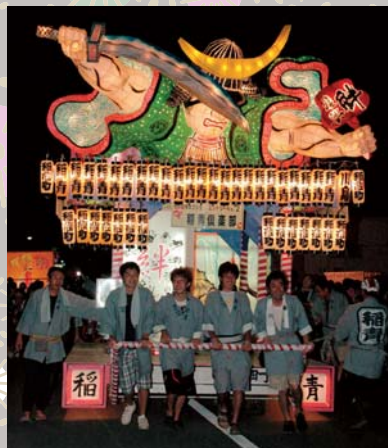
市民手作りの創作ねぶた

子愛好会のお囃子を先頭に本場青森の人形ねぶた2基のほか、市民手作りの創作ねぶたや神輿が稲荷神社周辺を練り歩き、笠間の夜を大いに盛り上げました。 また、市内21団体約1,200人の跳ね人が「ラッセーラー」の威勢のいい掛け声と踊りで、訪れた約37,000人の見物客を楽しませました。