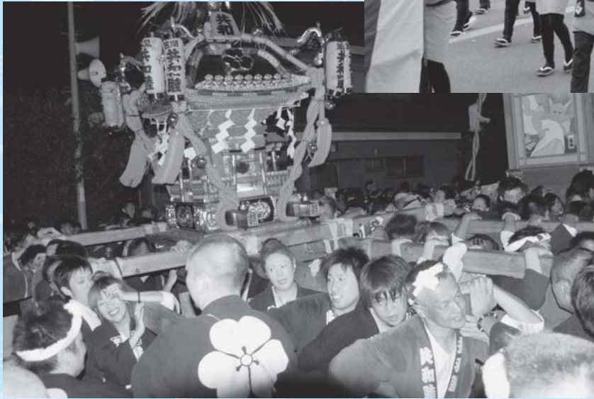
笠間の神輿も勢ぞろい