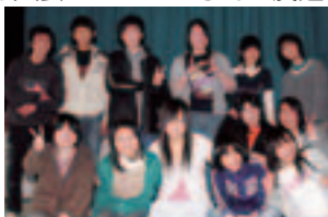
【公民館で記念写真!!】

私たちは、主催事業として小学生対象のクリスマス会や他の市町村のリーダーズクラブとの交流のために交流会などを開催しています。