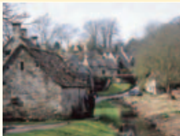
バイブリー(イングランド) ミカミ(泉)