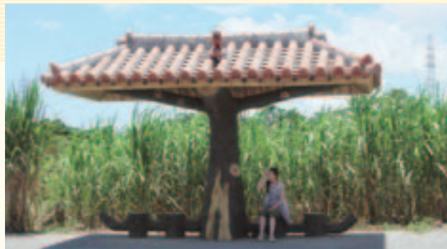
沖縄の風 ポンキチ(大田町)