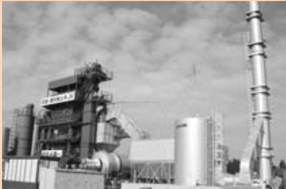
アスファルトを製造するプラント

このほど、北関東自動車道友部インターチェンジ（IC）と笠間IC（仮称）間を舗装するプラントが完成し、2月5日、火入れ式が行われました。火入れ式とは、プラントのつづがない操業と安全を祈願し、プラントの点火スイッチを押す儀式。同区間約9 キロメートル の開通に向け、工事がいよいよ仕上げ段階に入りました。