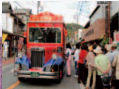
笠間稲荷門前通りと周遊バス