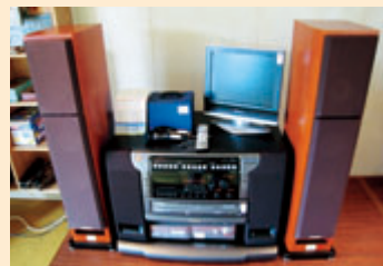
カラオケセット (関戸農村集落センター)