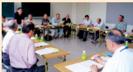
不法投棄ボランティア監視員の皆さんによる発足会議

近年、市内での不法投棄が絶えません。そこで笠間市では、不法投棄を市民と協働で撲滅しようと、公募による一般市民17人をボランティア監視員に任命し、7月20日、笠間市不法投棄ボランティア監視員の発足会議を開きました。集まった皆さんは、不法投棄