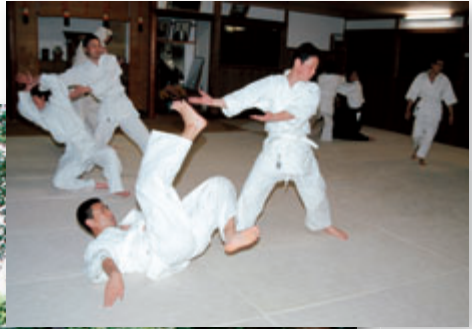
茨城支部道場稽古風景