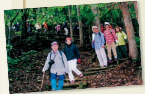
霧降高原へのハイキング