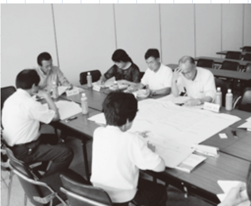
かさま環境市民懇談会