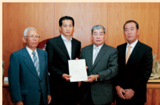
協定を締結した山口市長と管工事組合の皆さん

また、組合に加盟する19社は、所有する自動車に「かさまっ子見守り隊」と書かれたステッカーを貼り、子どもの安全パトロールにも協力しています。