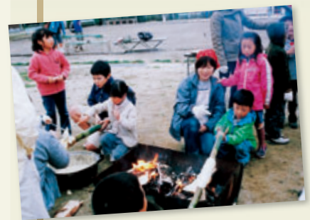
城南秋のフェスタ (バームクーヘン作りに挑戦)