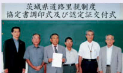
里親になった「下市毛まちづくり同好会」の代表の皆さん(中央の4人)

道路里親制度とは、茨城県管理の道路を「里子」に、沿道のボランティア団体を「里親」にたとえて、道路の清掃美化活動を県に代わって行ってもらう制度です。このほど、「下市毛まちづくり同好会」が道路の里親に認定され、7月26日、友部公民館で協定書の調印式と認定証の交付式が行われました。認定された道路は、笠間駅南の主要地方道笠間・つくば線のうち約1.3キロメートルの区間。県が用具の支給などを