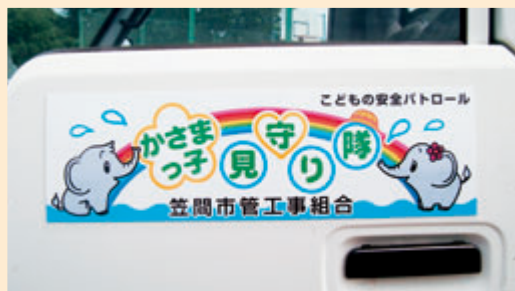
車に貼られた「かさまっ子見守り隊」のステッカー