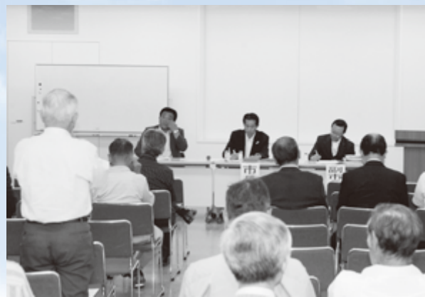
岩間支所で行われた市政懇談会