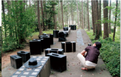
マジシャンクレーのプラットフォーム