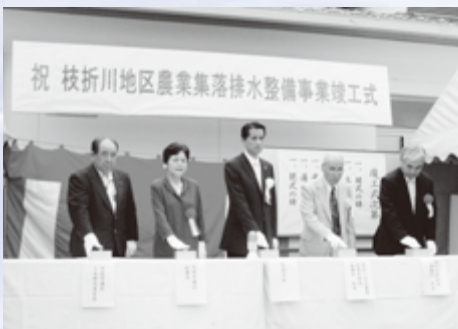
関係機関代表者による通水式

このほど、枝折川地区農業集落排水処理施設が市内柏井に完成し、8月29日、竣工式が行われました。この施設は、生活環境の改善と公共用水域の水質保全を目的に、随分附と柏井地区で平成12年度から整備が進められてきたもので、330戸のし尿・生活雑排水を処理する施設と総延長16,374メートルの管路、16箇所の中継ポンプで構成されています。竣工式では、施設用地協力者や枝折川地区農業集落排水事業推進協議会役員の皆さんなどに感謝状が贈呈された後、関係機関代表者による通水式が行われました。