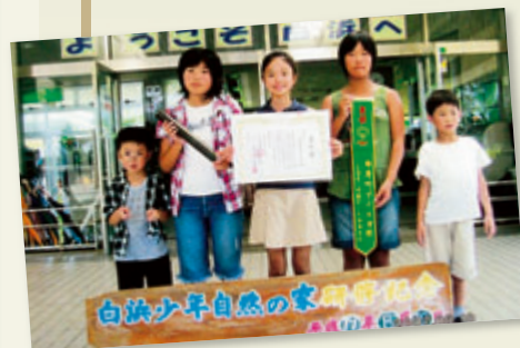
全国子ども会連合会より表彰を受けました