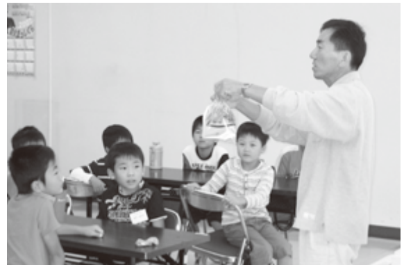
おもしろ理科先生の理科実験

わたしは、月に1回わんぱく教室に行っています。わんぱく教室では、いろいろなことをやります。一番楽しかったのは、キーホルダー作りです。なぜかという、今までで一番絵がじょうずにかけたからです。アイスクリーム作りやとうげいも楽しかったけど、やっぱり一番は、ほかの学校のお友だちがたくさんできたことです。