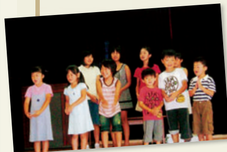
敬老会で歌を披露