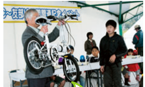
やったぁ。豪華賞品、ゲットだぜ!!!