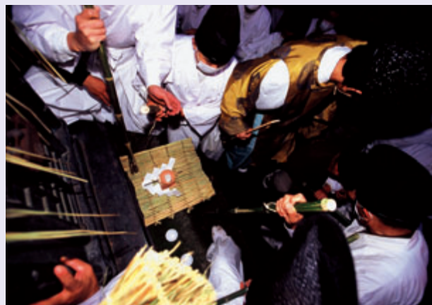
写真中央の供物を奪われないよう、青竹を構える白装束の天狗

「悪態まつり」は、愛宕神社の北側にある飯綱神社の十三天狗の祠で行われます。毎年旧暦の11月14日に行われるのが慣例となっていますが、今年は12月16日に行われました。13人が白装束で天狗の格好をし、十三天狗の祠にお供え物をして回りますが、このとき、参詣者が天狗に向かって悪態を吐き、天狗に邪魔されながらお供え物を奪い合うという変わったお祭りです。この供物を持ち帰ると無病息災・家内安全・五穀豊穡のご利益があり、また、悪態が幸運をもたらすともいわれており、参詣者たちは先を争って供物を奪い合いました。