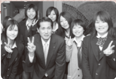
いなり寿司おひろめパーティー(12/9) で友部高校演劇部の生徒と