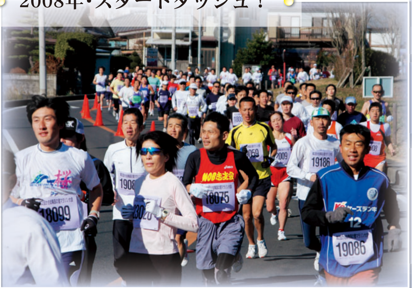
第2回かさま陶芸の里マラソン大会(12/16、笠間芸術の森公園)