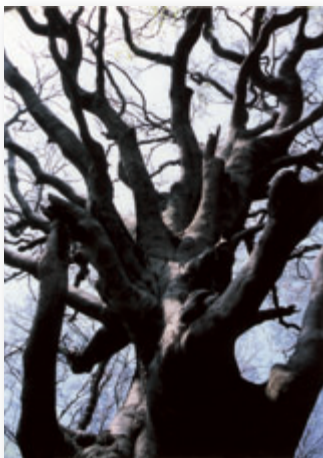
市の天然記念物 吾国山のブナ林の巨樹