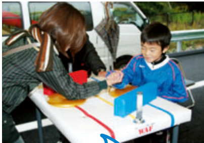
ぼくの方が強いゾッ!!