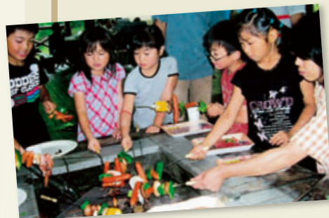
みんなで楽しくバーベキュー(城里町)