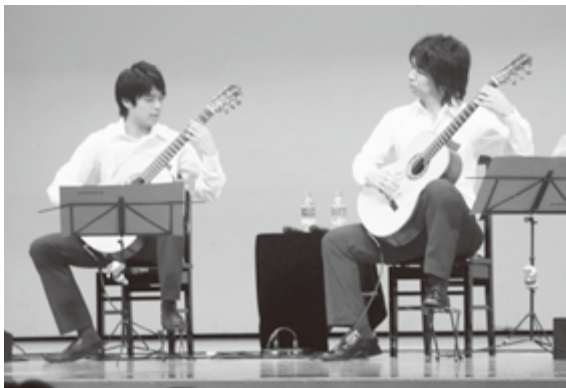
12月2日 笠間公民館 大ホールにて

ユニークなトークを交えてのとても素晴らしい演奏会で、癒しのひと時を過ごせました。