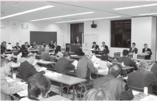
市役所本所で行われた第5回市政懇談会

ちづくり教室だけでなく、男女共同参画、子育て、国際交流、社会福祉協議会登録のボランティア団体など、すべての団体の拠点として考えていかなければなりません。市では、公共施設の有効活用や民間施設の利用など活動拠点整備の方向性について検討していきます。