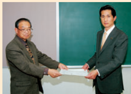
◀水墨画の目録を市長に手渡す飛田画伯