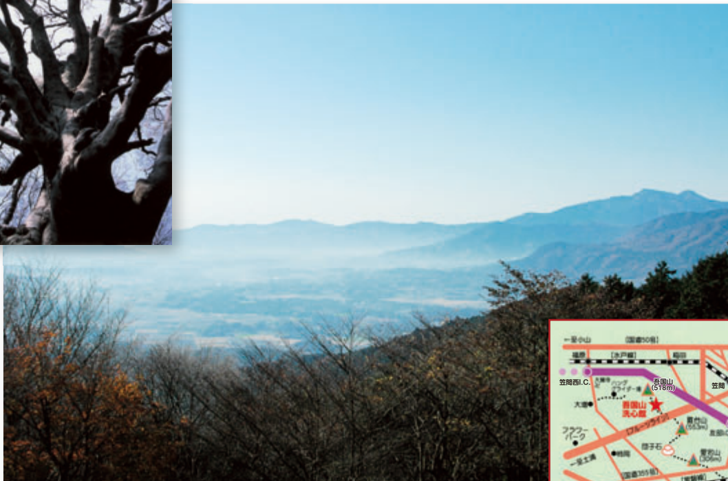
吾国山洗心館研修棟からの眺望(右奥は筑波山)