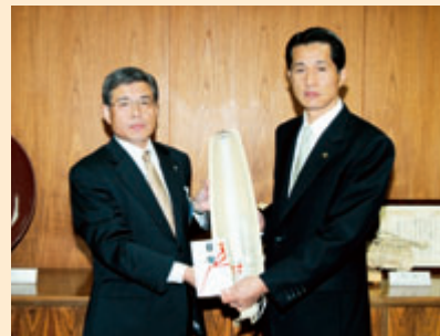
▲防犯灯を市長に手渡す東京電力笠間営業所長