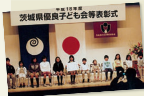
優良団体として表彰を受ける子どもたち

子ども会として唯一の参加となった笠間のまつりでは、今年は「ぶた」のねぶたを作り、骨組みから紙を張る作業まで、子ども会と育成会が一体となって行い、完成させました。その結果、「光のオブジェの部」で優勝を飾ることができました。これからも元気に明るく活動していきたいと思っています。