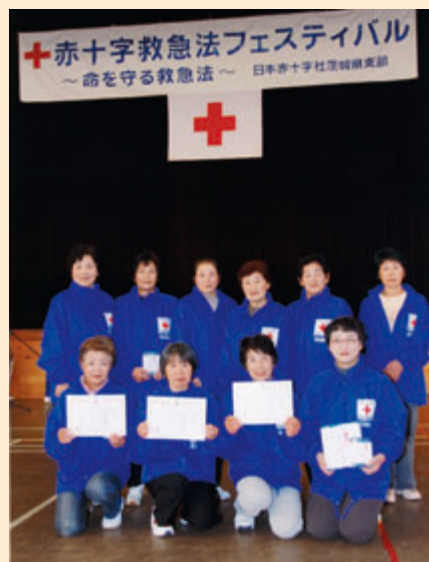
入賞した笠間市赤十字奉仕団岩間分団の皆さん