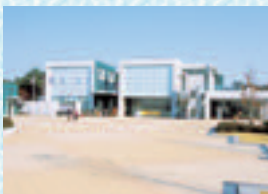
茨城県陶芸美術館