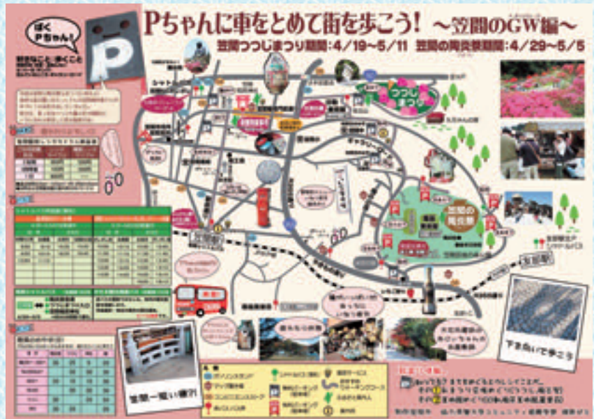
笠間地域資源散策地図「笠間のゴールデンウィーク編」