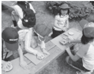
私だけのコースターよ！