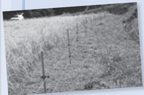
電気柵が設置されている水田