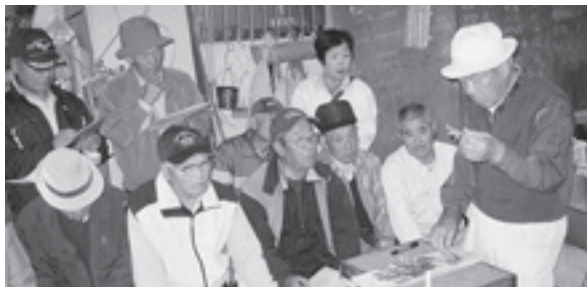
栽培所職員の説明を熱心に聴く参加者の皆さん

この秋には、市民菊花展や市内各所で、丹精込めて育てられた多彩な菊を見ることができましょう。今から、楽しみです。