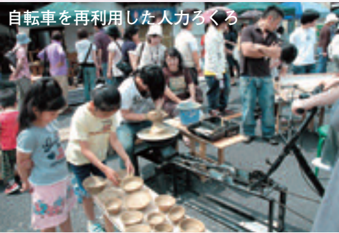
自転車を再利用した人力ろくろ

プロ、アマチュアを問わず、「ものづくり」にこだわる本物の作り手、隠れ名人、自称名人などが全国から集まり、来場者との交流を深める第6回「笠間ハンドメイドフェアin弁天町」が、6月7日と8日、JR笠間駅前通りで開かれました。約280メートルを歩行者専用にした道路には、木工品やアクセサリー、陶器、飲食など113の店舗がずらり。手作りへのこだわりから、笠間高校の生徒が作った笠間焼の弁天町通貨「モチヨ」が登場したほか、常磐大学の学生による「笠間ぐるっとミュージアム」が披露されました。