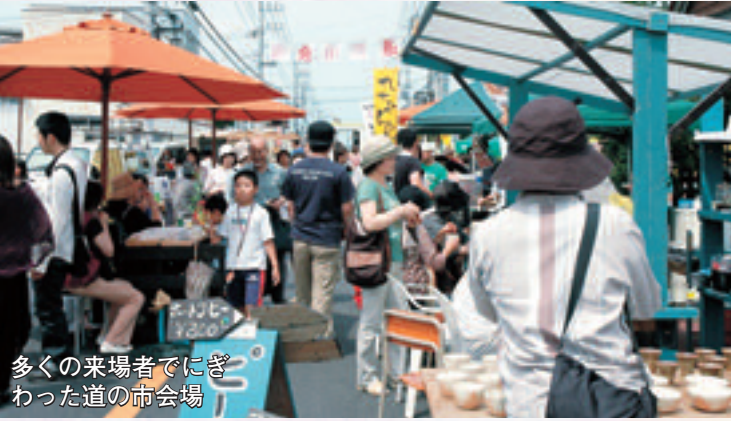
多くの来場者でにぎわった道の市会場