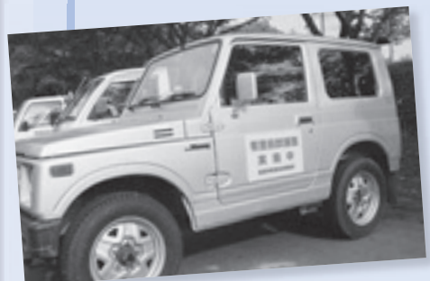
捕獲活動に使用する四輪駆動車