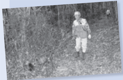
捕獲に向かう隊員と猟犬

本年度も実施を予定しており、実施時期は広報等でお知らせしますが、山に入る際は、見通しの良い道を利用したり、ラジオ等の音響機器を持って隊員に自分の存在を知らせたり、目立つ格好・服装をするように心がけてください。