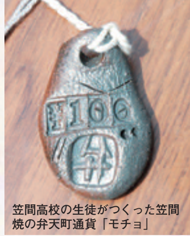
笠間高校の生徒がつくった笠間焼の弁天町通貨「モチヨ」

プロ、アマチュアを問わず、「ものづくり」にこだわる本物の作り手、隠れ名人、自称名人などが全国から集まり、来場者との交流を深める第6回「笠間ハンドメイドフェアin弁天町」が、6月7日と8日、JR笠間駅前通りで開かれました。約280メートルを歩行者専用にした道路には、木工品やアクセサリー、陶器、飲食など113の店舗がずらり。手作りへのこだわりから、笠間高校の生徒が作った笠間焼の弁天町通貨「モチヨ」が登場したほか、常磐大学の学生による「笠間ぐるっとミュージアム」が披露されました。