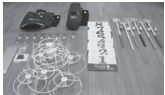
購入したグラウンドゴルフセット

随分附区会は、このほど、(財)自治総合センターのコミュニティ助成事業を活用し、スポーツ・文化活動用備品（カラオケセット、少年野球用具、グラウンドゴルフセットなど）を購入しました。この事業は、宝くじの普及と広報を目的として、地域のコミュニティ活動に必要な備品の整備に助成を行うものです。この事業を利用したい団体（区・自治会）は、市民活動課（内線134）にお問い合わせください。