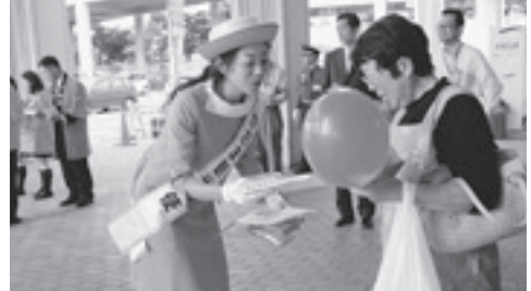
買い物客にマイバッグとチラシを配るかさま観光大使

笠間市消費者友の会 笠間市男女共同参画推進連絡協議会 かさま環境を考える会 笠間市レジ袋削減運動推進委員会 友部ごみを考える会 岩間環境美化推進協議会 かさま環境市民懇談会 笠間高校 友部高校