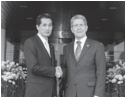
笠間市役所を表敬訪問したドイツ・ラー市の市長と(11/12)

私の第1番目は、10月に岩間支所庁舎が「市民センターいわま」として生まれ変わったことあります。次は、「デマンドタクシーかさま」の