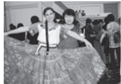
パラグアイの民族衣装と国際交流協会会員