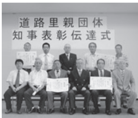
表彰された里親団体の皆さん

道路の美化活動に対する功績が評価され、このほど、市内の里親団体3団体を含む4団体が茨城県知事表彰を受けました。里親団体とは、県道の清掃美化活動などを支援し、地域にふさわしい道づくりに貢献している団体です。表彰を受けたのは、秋桜の会（仁古田地内の県道大洗友部線及び県道石岡城里線）、まちづくり穴戸塾（平町地内の県道大洗友部線）、ひまわりの会（安居地内の県道茨城岩間線）と大洗町の団体の4団体。道路の除草や清掃、草花の植え替えなどを行い、地域の道路美化に積極的に取り組んでいます。また、これらの団体のほか、笠間市岩間地区日赤奉仕団、土師ひやくしょう塾、下市毛まちづくり同好会の合計6団体が市内の清掃美化活動を実施しています。