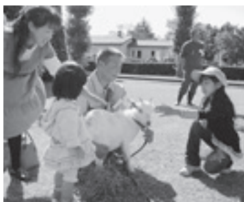
子ヤギと遊ぶ子どもたち

獣医学や応用動物学の実習教育、畜産物の安全性評価などの研究をしている東京大学附属牧場。市内安居にある同牧場では、地域に開かれた施設として、毎年「無料公開デー」を開催しています。今年は11月1日に開催され、子どもたちと子ヤギとの触れ合いや乗馬体験などが行われました。また、地域ブランド米「笠間の粹 う米」を使ったおにぎりや、はなさか市民農園で採れたサツマイモの焼きいもなども提供され、多くの市民が秋の恵みを味わいました。