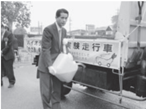
バイオディーゼル燃料を給油する山口市長

バイオディーゼル燃料を使用した公用車の走行式が、11月7日、市役所の庁舎前で行われました。この取組みは、市内2か所の学校給食センターから出る廃食用油を精製し、公用車3台に使って実証運転を行うという初の試み。市内の事業者が行うバイオ燃料精製の試験事業に協力する形で、来年6月まで行われる予定です。