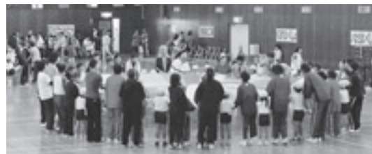
全員参加で楽しんだプレイバローン

10月18日、市民体育館で「第3回笠間市ふれあいスポーツの集い」が行われ、600人を超える市民が参加しました。この集いは、障害のある人もない人も、大人も子どももスポーツを通してふれあい、社会参加することで、健康と生きがいにつながることを目的としています。