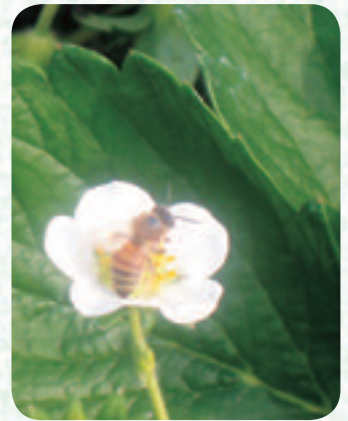
▲ミツバチが受粉のお手伝い

「より良いものと思うと、いちごの研究(勉強)には終わりが無い。実に赤い色が付くまでは緊張のしどおしだよ」と皆さん言います。収穫できるまでにかかる月日は1年以上。「でも、赤い実が付くと、その苦勞も吹っ飛ばよ」と話してくれました。