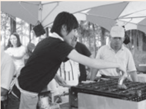
鯉焼きの修行中です

様々なイベントで「鯉焼き」を出店すると、焼きたてをその場で食べる人、お土産に買って帰る人、食べておいしかったからとまた買いに来てくれる人など、笠間の皆さんとの交流を通して、笠間をより身近に感じることが出来ます。これからも笠間の皆さんとの触れ合いを大切に、まちづくり活動にかかわっていきたく思います。