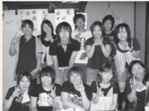
笠間のまつりにも参加