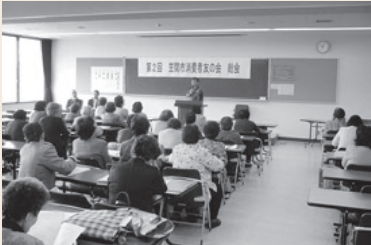
平成 20 年度総会