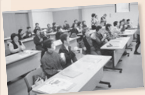
県畜産センターでのチーズ作り