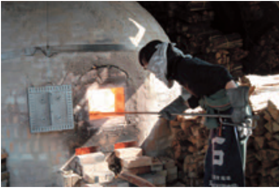
写真上：笠間焼と生け花のコラボレーション 写真下：まる6日間続けられた登り窯による焼成

昭和61年から、毎年、都道府県持ち回りで開催されてきた国民文化祭が、この秋、茨城県内の34市町村を会場に開催されました。