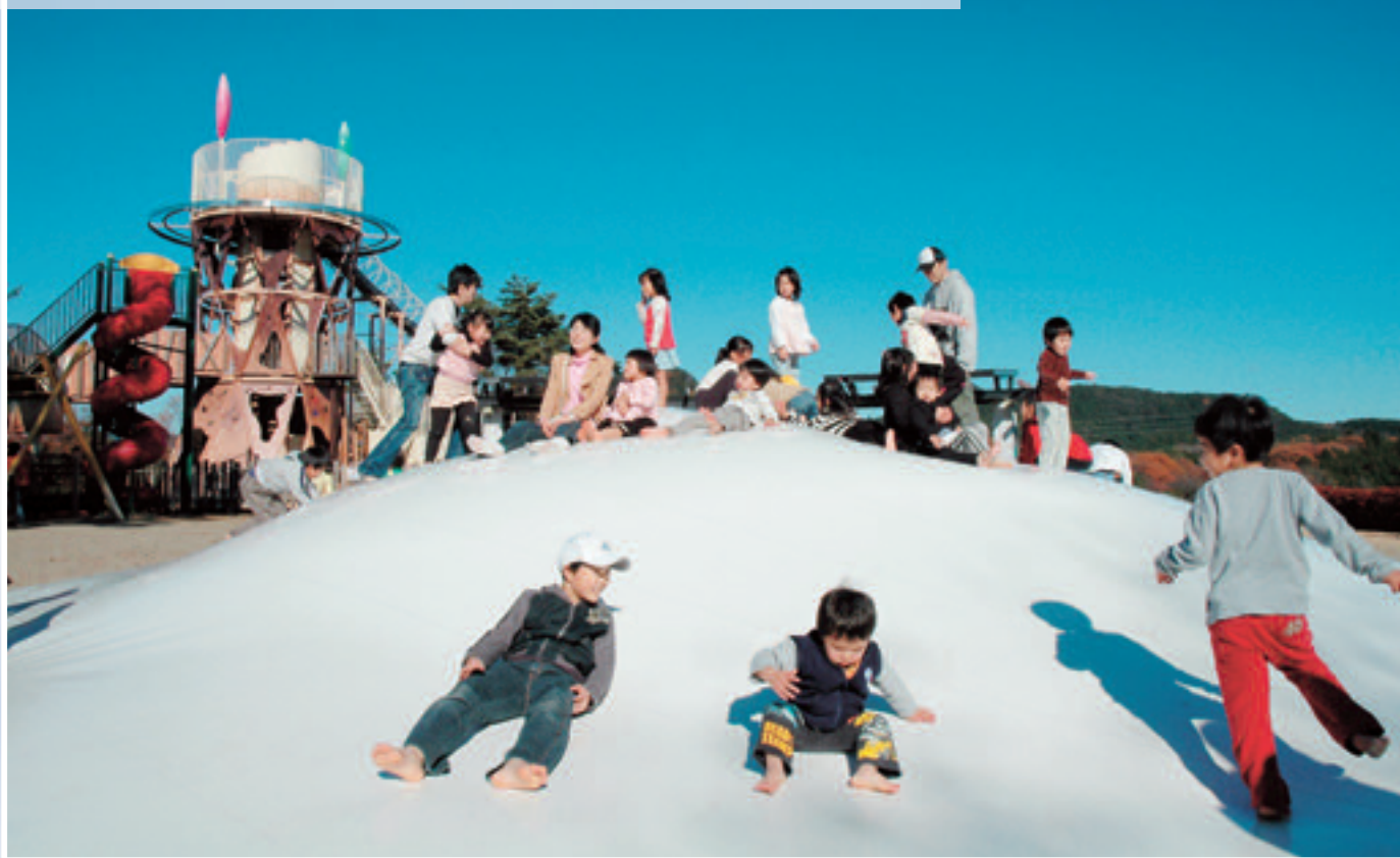
あそびの杜（笠間芸術の森公園内）にある人気の「ふわふわドーム」