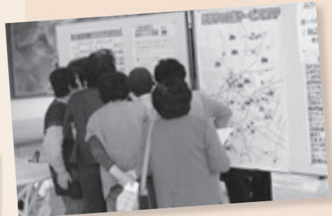
平成 20 年度消費生活展