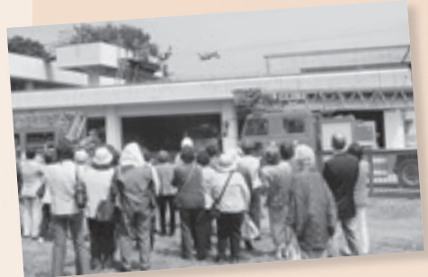
「いざという時のために」(消防署)の 出前講座を受講