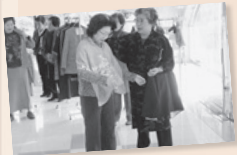
平成 20 年度消費生活展 「リフォームファッションショー」

私たちの一大イベントになっている消費生活展。今年は「まちの駅『かさま』市民交流広場」で開催しましたが、食の安全や高齢者の福祉、レジ袋削減活動、消費生活問題についての学習の成果を展示発表することができ、来場された方々の理解をより深めていただけたと感じています。今後は出前講座にも挑戦し、会員同士が楽しく活動しながら、地域の方々と触れ合いの輪を広げていきたいと思っています。