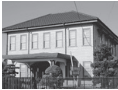
笠間市立歴史民俗資料館