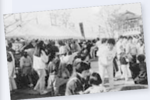
駅前フェスタ （笠間駅前）

笠間駅前の稲荷町が、表玄関として振興発展することが市の隆盛につながるの思いから、区民一体となってまちづくりに励もうと「町内会」を結成しました。そして、有志により「未来に伝える街文化―笠間そして稲荷町の唄」の出版に取り組み、区民各家庭の今昔の様子を「DVD」に、町誕生120年の歩みを小冊子にまとめ、このたび完成しました。区民一同これを誇りにして、益々よいまちづくりに生かそうとしています。市民の皆さん、ご覧ください。