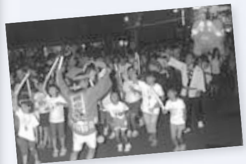
笠間のまつり （子供ねぶた）