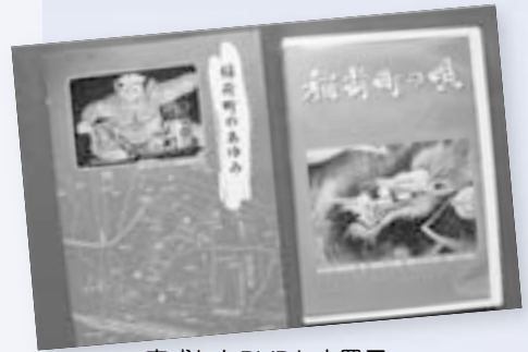
完成したDVDと小冊子