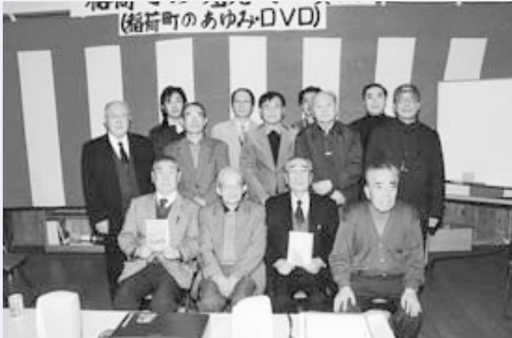
稲荷町の唄完成祝賀会