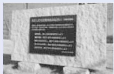
市民憲章碑(笠間図書館)