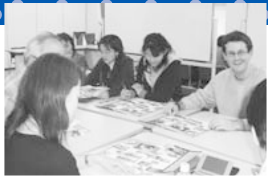
笠間の観光ガイドを使って 英語でガイドするための研修をする協会員