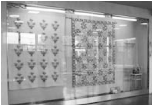
展示ケース（友部公民館）