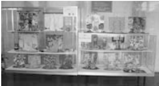
ガラスケース（友部公民館）

興味のある方は、友部公民館（TEL0296-77-7533）までご連絡ください。