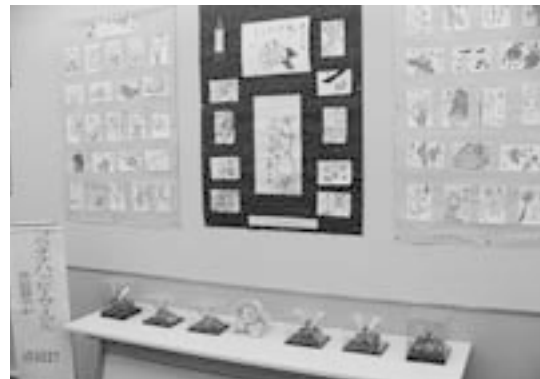
絵手紙の作品展示（岩間公民館）