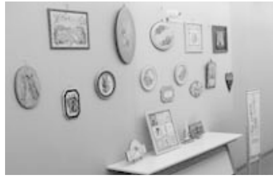
トールペイントの作品展示（岩間公民館）