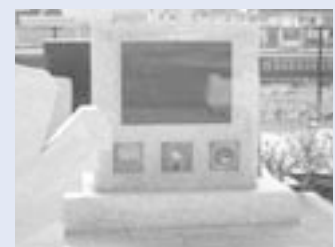
市民憲章碑(友部駅北口広場)