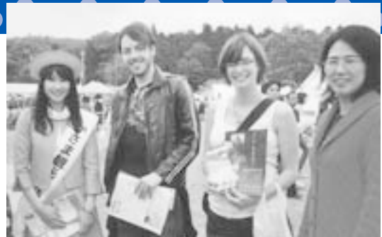
ドイツ人の観光客に ホームタウンガイドをする協会員