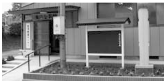
玄関入口などを改修した地域の集会所