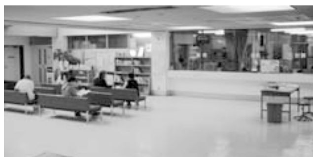
明るく親しみやすいロビーに改修を予定

新たな医療機器の導入や老朽化した医療機器を更新し、利用される方に安心・信頼される医療を提供します。また、院内改修工事等を実施し、明るく・ひとにやさしい環境づくりに努めます。 導入予定の医療機器 全身用X線CT装置、CT現像機、全自動散葉分包機、輸液ポンプ、病棟用電動ベッド、ポータブル超音波診断装置など