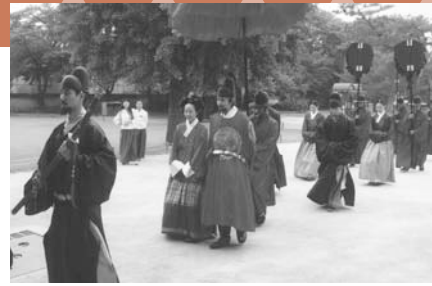
協会の異文化体験 韓国の古式の結婚式(ソウル市内)