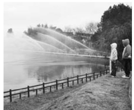
放水試験（岩間地区）