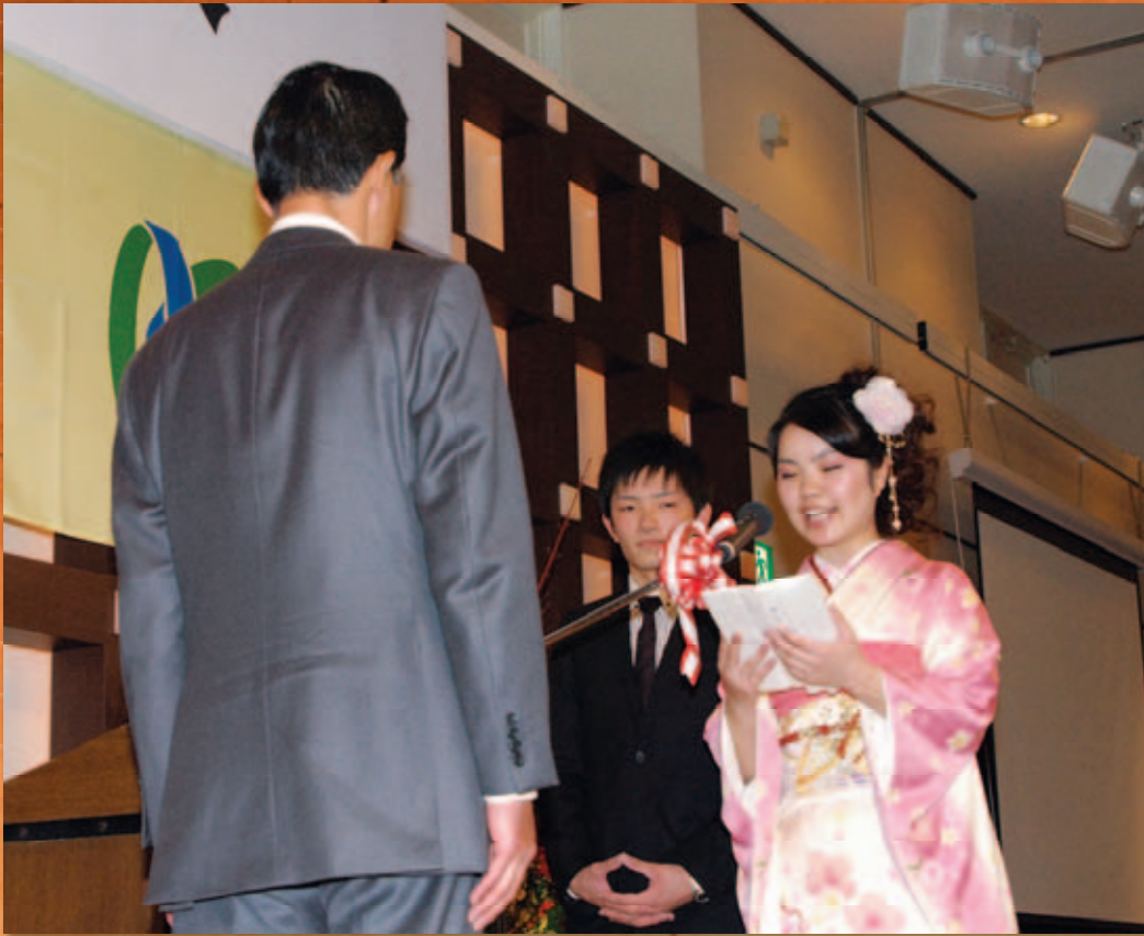
新成人代表による誓いの言葉