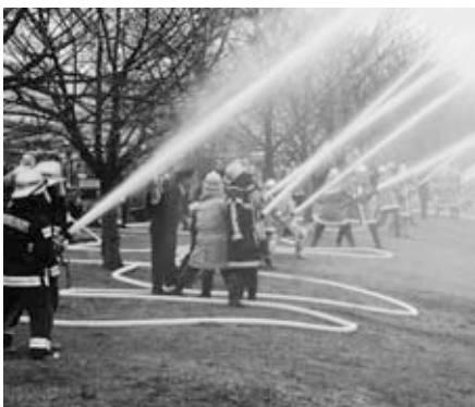
放水試験（笠間地区）

1月11日、岩間総合運動公園（押辺）で平成22年笠間市消防出初式が行われ、笠間市消防本部と消防団あわせて約600名が参加しました。 式では、人員・姿勢および服装点検や分列行進の後、永年勤続等の表彰や感謝状の贈呈、訓示等が行われました。 続いて、笠間・友部・岩間3地区それぞれの会場に分かれて放水試験が行われました。 消防車両から一斉に放水されると、集まった家族連れなどから歓声が上がりました。