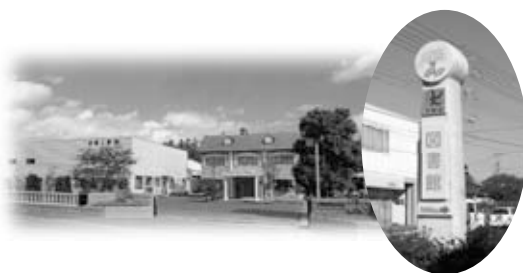
(左) 工場外観 (右) 案内看板

うため、平成4年に操業を開始した当社の主力工場です。製品のほとんどは手作りで、それを支えるのが強化プラスチック成形の技能士たちです。国家資格である1級技能士が7人もいる工場は、県内でも珍しいでしょう。木型を専門に作る職人もおり、最近ではNCマシニングを導入、ISO9001も取得し、当社のFRPで作れないものはないと自負しています。皆さんも、身の回りのFRP製品を探してみてください。きっと意外なところに活用されていますよ。」