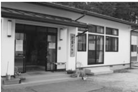
南小学校児童クラブ

昭和42年に建設された岩間中学校の改築や友部中学校体育館の耐震補強に活用しました。また、南小学校の児童クラブ整備や合併により大きなスペースが生じていた岩間支所に子育て支援センターとポランティアセンター、公民館および図書館を整備し、名称も「市民センターいわま」としました。