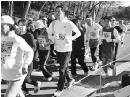
陶芸のマラソン大会に参加、スタート風景

や責任ある経営を行っていただきたいです。本市も空港をいかに有効に活用するかを考え、地域活性化に取り組みなければなりません。たとえば、韓国ソウル付近の焼物の街イチョンとの陶芸交流や国際交流、市内観光施設やゴルフ場への外国人誘客、茨城空港周辺地域資源推進連絡会等との取り組みを通して、地域経済へのプラス効果を導き出してまいります。