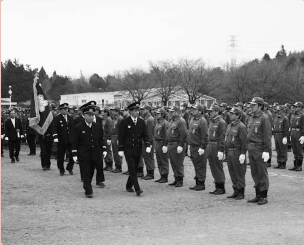
人員・姿勢および服装点検