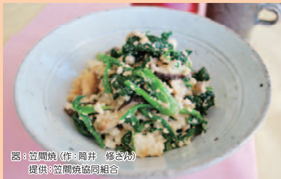
器：笠間焼 (作：筒井 修さん)

厚揚げをつぶして作る簡単においしくできる白和えです。青菜やきのこを入れて、よりヘルシーにお召し上がりください。