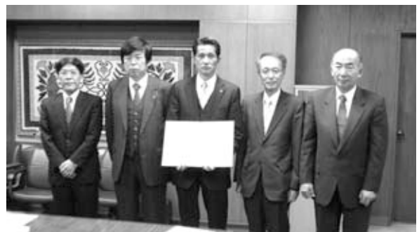
平日夜間一次救急診療に関する協定調印式にて

このことにより、4月1日から市医師会の民間医療機関と公立病院が連携・協力して、平日午後7時～10時までの救急診療を市立病院が実施します。また、休日救急診療当番医制を変更し、毎週日曜日の診療を市立病院が実施します。