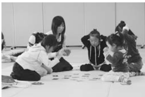
〈かるた取りを楽しんでいる様子〉

笠間図書館では、絵本などを題材とした「かるた」がたくさんあります。貸出ができますので、ぜひ、お家でもかるた取りを楽しんでください。