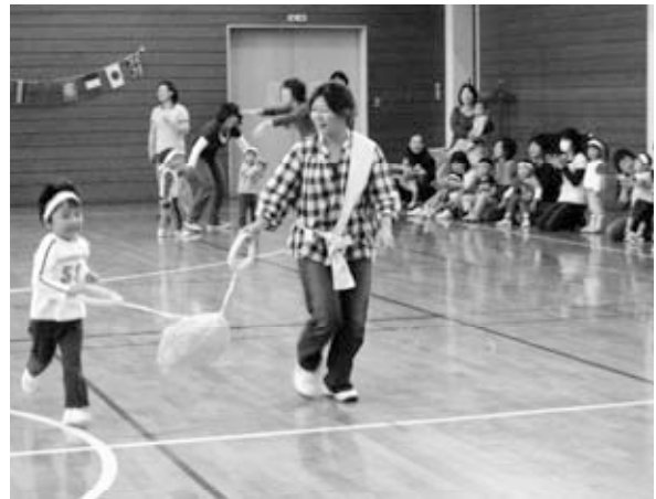
母と子の教室の運動会の様子