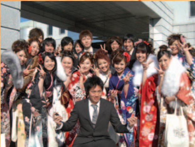
久しぶりに会った同級生たちと記念撮影