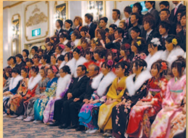
出身中学校ごとに行われた記念撮影