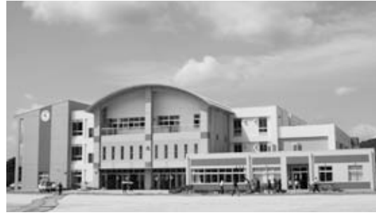
岩間中学校の新校舎