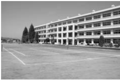
耐震補強された友部中学校

平成18年度から実施していた友部中学校の耐震補強が完了しました。市内小中学校8校に約100基のトイレを整備し、全ての小中学校に洋式トイレを設置しました。また、地域の発展のため岩間駅周辺整備事業に活用しました。