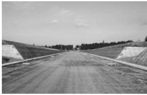
完成予定の市道1級12号線

旧市町を結び市道友部1級12号線並びに市道岩間1級12号線、岩間八郷線、友部池野辺線など複数の幹線道路が開通する予定です。また、岩間中学校の改築が完了し、2学期から新しい校舎で授業が行われています。