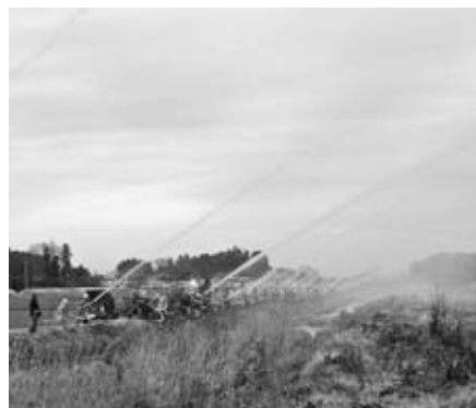
放水試験（友部地区）