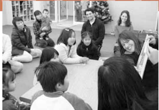
「図書館での英語の絵本読み語り」