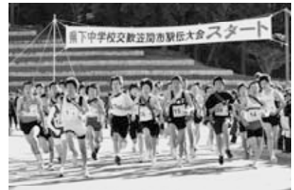
県下中学校交歓笠間市駅伝男子スタート