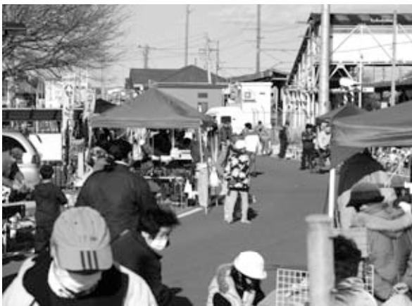
たくさんのお客さんにぎわう「バザール de いわま」