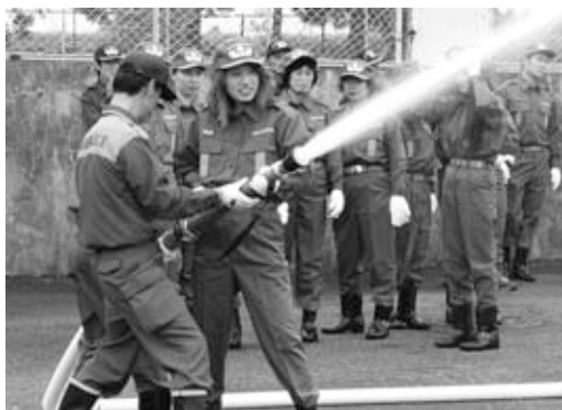
県立消防学校での消防団員新人研修