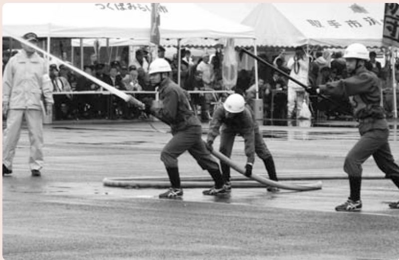
全国消防操法大会茨城県代表選考会の様子

消防団は、仕事としてではなく『自分たちのまちは自分たちで守る』という郷土愛護の精神を基本に活動しています。 火災や地震、台風等の災害が発生したときの活動のほかにも、日ごろから火災予防のパトロールや地域住民への消火器の使用方法の指導等を行い、地域防災の要として重要な役割を担っています。しかし、年々消防団員数が減少傾向にあり、団員の確保に苦慮している状況です。地域防災の中核となる消防団員数が減少している今こそ、郷土を守るあなたの『力』を地域のために活かしてください。