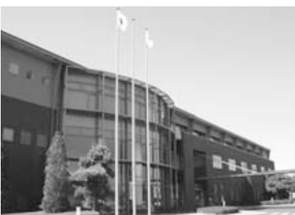
市民センターいわま