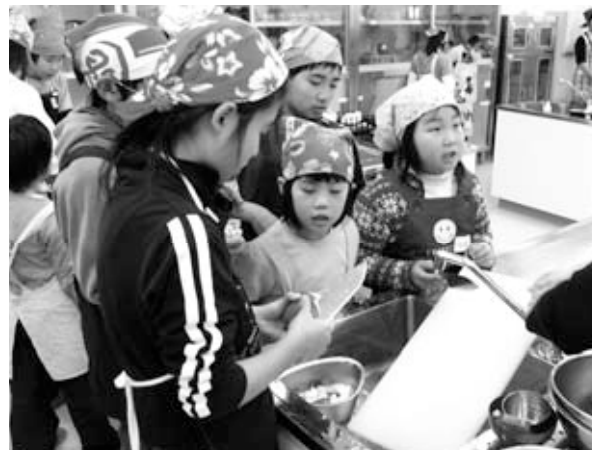
第7回エコクッキング ライスバーグケーキづくりの様子