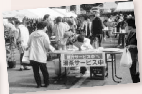
大地の宴(秋市) 豚汁・湯茶のおもてなし