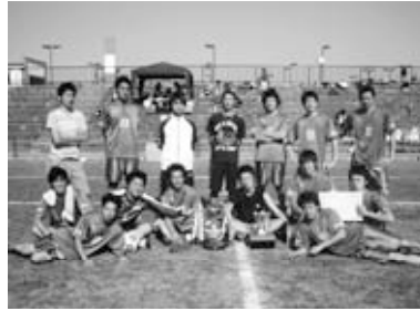
優勝した金陽社のメンバー

※優勝した金陽社は、茨城新聞社杯ふるさとドリームマッチ～第4回市町村サッカー協会チャンピオン大会～に笠間市代表として出場