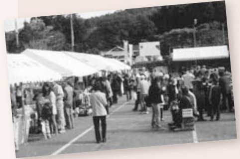
大地の宴(秋市) 地元住民や観光客とのふれあい