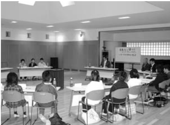
キッズ・タウンミーティングの様子

子どもたちが市長と対話できる場をつくろうと、12月25日、岩間公民館で青少年育成岩間地区市民の会主催による「キッズ・タウンミーティング」が開催され、岩間一小・二小・三小の6年生20名が参加しました。不審者対策や通学路の安全確保など子どもたちの身近な問題から、公共施設の整備、観光や商店街の活性化の問題などさまざまな質問があり、市長も子どもたちが理解できるようにとても分かりやすい言葉で答えていました。