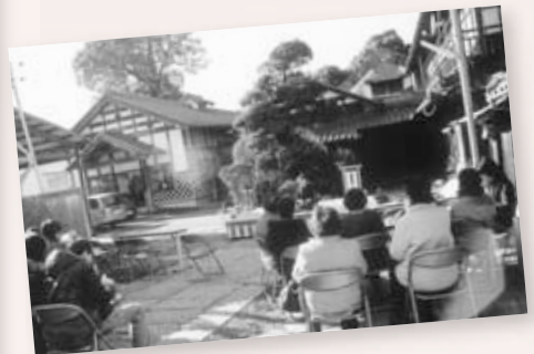
さしるフェスタ 茨大生による落語