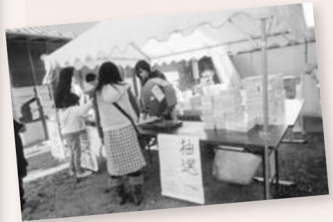
さしるフェスタ 豪華景品の当たる抽選会