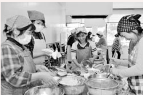
野菜たっぷりの豆乳野菜鍋を作っています

笠間市食生活改善推進協議会では「野菜をたっぷり楽しく食べよう、目標350g」をテーマに各地区で生活習慣病予防教室を開催しました。教室では、身近な食材で野菜がたっぷりとれる献立の調理実習（豆乳野菜鍋・DEパスタ・簡単ピクルス・みかん寒天ゼリー）と、保健師・管理栄養士によるメタボリックシンドローム予防のミニ講話を