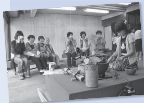
湯茶によるおもてなし(6月)