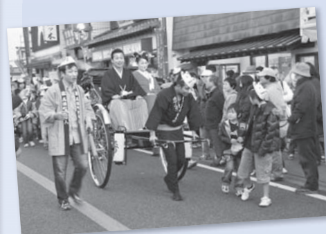
かさま狐の嫁入り

観光で来られる方、そして地元住民に愛される商店街を目指して今後とも活動していきます。