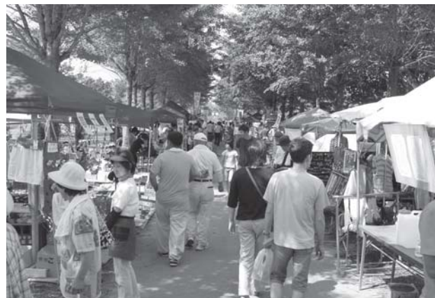
多くの来場者でにぎわう「笠間いきいき市場」