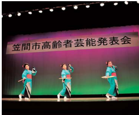
昨年度の芸能発表会の様子

芸能発表大会は、例年2月に笠間公民館大ホールで開催されています。各支部から15組、歌謡曲・民謡・舞踊・詩吟などさまざまなジャンルの芸能発表が行われます。