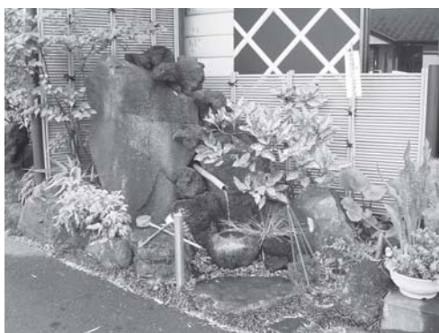
水汲み場は市民にも開放されている

— 今後の目標を聞かせてください。 — 会長「初代社長は『豆腐と水には旅をさせるな』とよく言っていました。価格に惑わされることなく、安全な素材を顔の見える関係でお客様にお届けし、店の暖簾を守り続けることが大切だと考えています。」