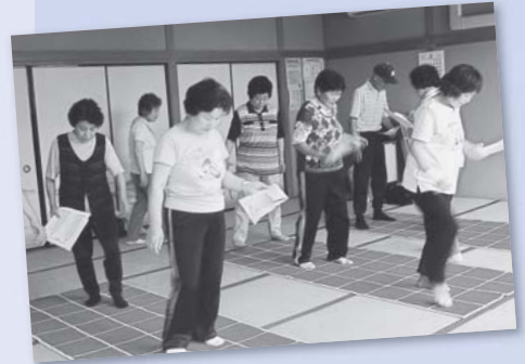
熱心にスクエアステップ