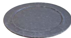
【笠間焼の提供】 田村 俊介(向山窯) サイズ:約22cm×22cm

撮影に使用する笠間焼を提供してくれる協力店(者)を募集しています。詳しくは、市役所本所秘書課までお問い合わせください。ご応募お待ちしております。