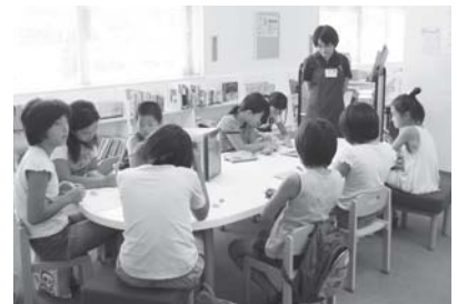
第2回 百科事典を使いこなそう！の様子

7月下旬から8月中旬にかけて、全4回の講座を開催しました。本の歴史やしぐみ、百科事典の使い方、図書館の本の並び方や探し方、調べもののテーマの決め方などを楽しみました。