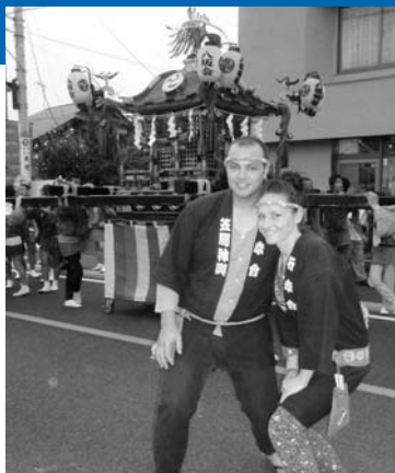
笠間の祇園祭で おみこし初体験