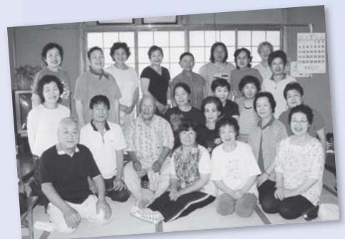
いきいきステップいなだの皆さんと