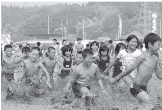
お宝めざしてレッツゴー！（宝探し）

今年初出場の子どもたちは、田んぼに足を踏み入ると「ぬるぬるする」「変な気持ち」と、思うようにならない足元に戸惑っていましたが、競技が始まると、笑顔で田んぼを駆け回っていました。昼食には地元のお母さん方からカレーが振る舞われ、思い出に残る夏の一日になりました。