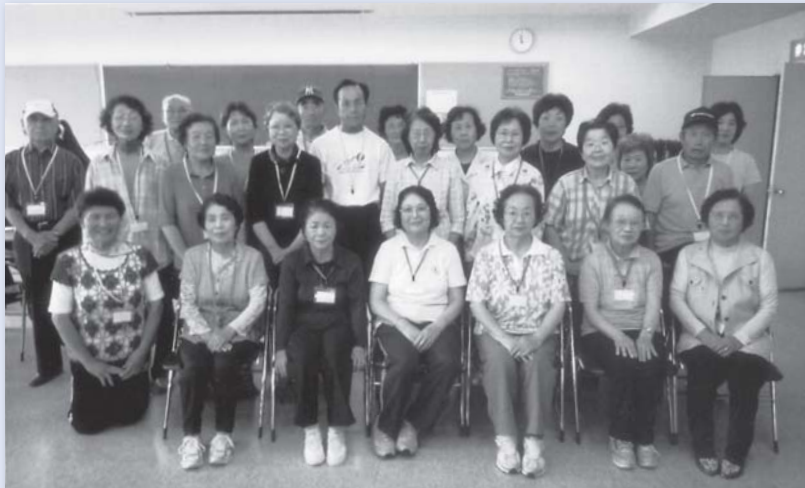
いきいきステップともべの皆さんと

このコーナーでは、市民の皆さんが自らの活動で地域貢献している団体などを紹介します。掲載を希望する団体は市民活動課へご連絡ください。