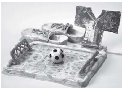
「めざせ世界」のストライカー A部門 文部科学大臣奨励賞

今回の作品で印象的だったのは、現在に目を向けたテーマを形にしたもので、2010ワールドカップやIT技術、さらには環境問題等、こども達が現実の情報や自分の夢をしっかりと表現していました。年々技術向上しているこども達の作品は、審査員のみなさんを驚かせていました。