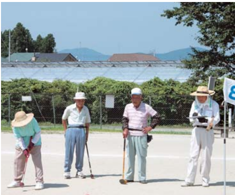
グラウンドゴルフ競技風景

高齢福祉課 内線1775 笠間支所福祉課 内線72163 岩間支所福祉課 内線73172