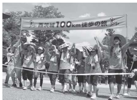
ゴールの瞬間、大きな達成感がこみ上げる