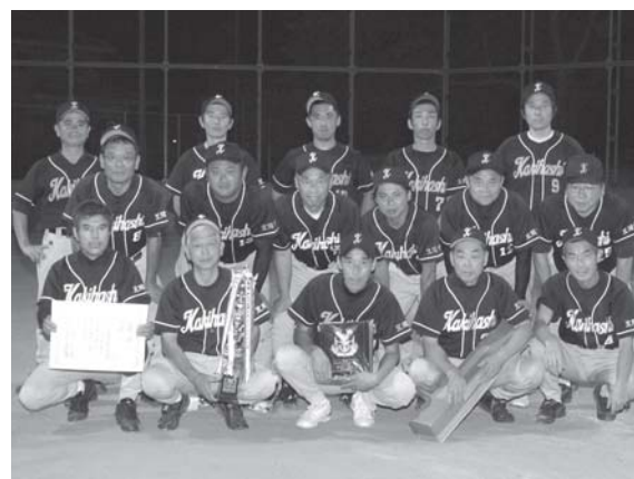
優勝した柿橋ソフトの皆さん