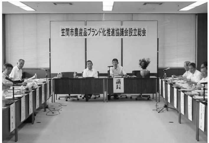
笠間市農産品ブランド化推進協議会設立総会の様子