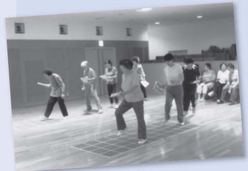
岩間・スクエアステップ自主教室での指導