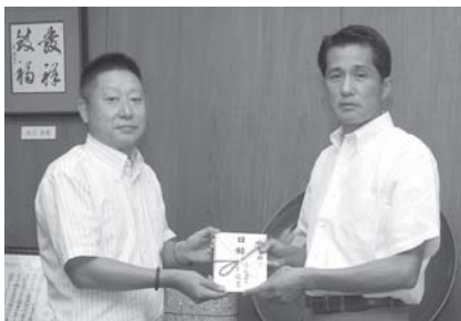
山口市長に目録を手渡す山城組合長

「安全・安心のまちづくり寄附金」として地域の防犯、防災、交通安全等の活動に活用します。今年度は、防犯活動に使用する誘導棒(LED)200本を購入する予定です。