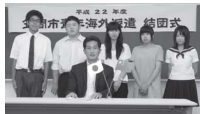
青年海外派遣の高校生と(8/9)

問において、中国共産党体制における経済成長、世界戦略、学生の勤勉さそして日本への強い関心などを感じ取りました。一方で富裕層と農村部との貧困の格差や、一人っ子政策の中での高齢化の進展、環境問題等、抱える問題も多くあり、今後どのように解決していくのか、日本の経験や技術が、これからの中国にとって必要であろうと認識しました。