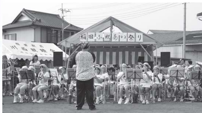
稲田小5・6年生による吹奏楽演奏

8月1日に稲田駅前ふれあい公園にて、稲田ふれあい祭りが開催されました。鯉焼き、焼きそばなどの販売や、かき氷の無料配布、金魚すくいなどが行われました。また、稲田小学校の吹奏楽演奏やフラダンスショー、ソーラン踊りなども披露され、小さなお子さんからお年寄りまで楽しんでいました。