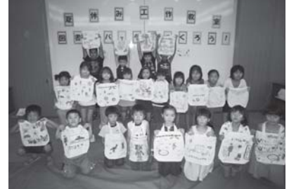
できあがったバッグと一緒に

8月4日に、夏休み工作教室「図書館バッグをつくろう！」を開催しました。ステンシルや、布用クレヨンを使って布バッグに絵を描き、世界で一つだけの素敵なバッグができあがりました。