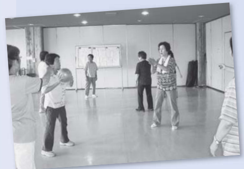
笠間・いきいき健康クラブでの指導