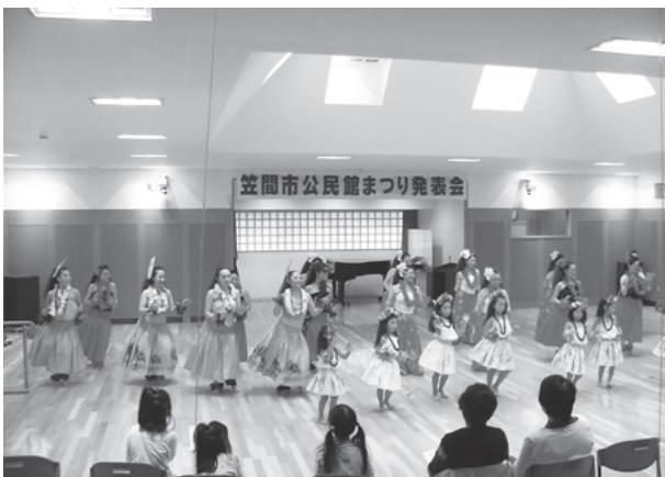
岩間公民館 発表会の様子