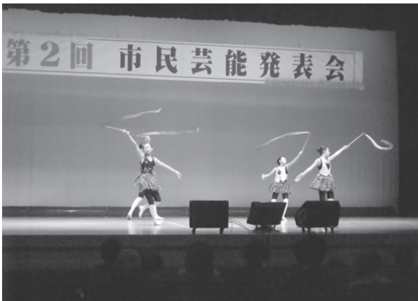
笠間公民館 芸能発表会の様子

サークル活動されている市民の方々の作品展や、発表会などの催し物が3公民館でそれぞれ行われました。子どもから大人まで数多くの皆さんにご来場いただき、盛大に開催されました。