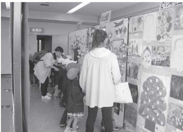
友部公民館 園児・生徒の作品展の様子