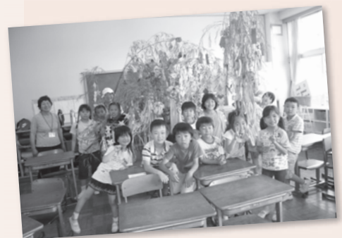
放課後子ども教室②七夕飾り