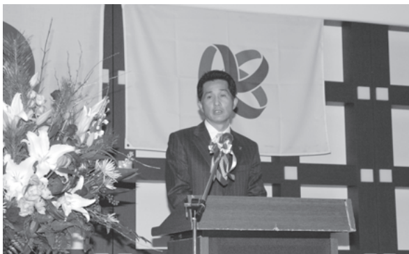
成人式でのあいさつ(1月9日)