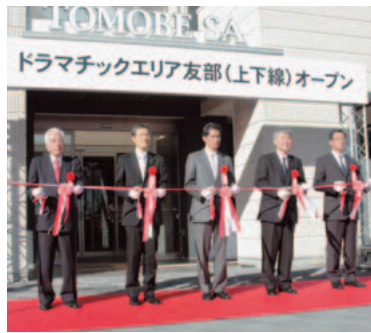
関係者によるテープカット

昨年12月15日、常磐自動車道友部SAが上下線同時に「ドラマチックエリア友部」として、リニューアルオープンしました。「武家屋敷」をモダンにアレンジした外観、室内は「蔵」をイメージしたデザインで、上り線では『私たちの海』を、下り線では『私たちの里山』をテーマにしたグルメゾーンやシヨッピングゾーンが設けられています。