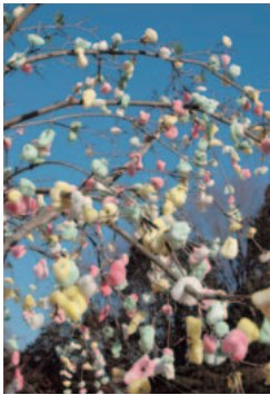
完成した繭玉飾り