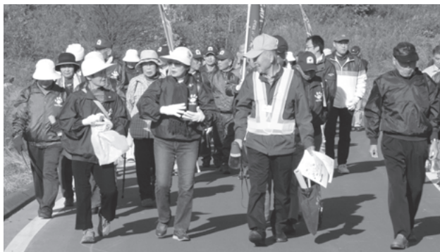
会話ははずみ参加者同士の交流も深まりました

この催しは、「江戸街道」を散策しながら市内に残る文化的な遺産を見学し、笠間市の歴史や文化への理解を深めること、また、ごみを拾いながら歩くことで、環境美化に貢献することを目的としています。