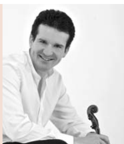
スヴェトリン・ルセヴ

ヴァイオリン スペシャルコンサート 日時 3月27日(日) 午後5時開演 会場 笠間公民館 大ホール 出演 スヴェトリン・ルセヴ 成田達輝 寺内詩織 曲目 ブラームス:ヴァイオリン・ソナタ第3番ほか 料金 大人 1,500円 小中学生 1,000円