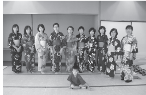
着付け教室の様子

初めての着付けですが、とても綺麗に着られました。私たちのように「和美人」になれますよ。