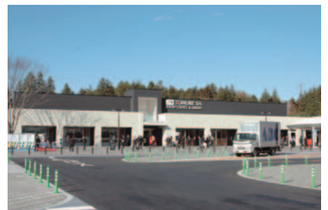
ドラマチックエリア友部(下り線)全景

北関東自動車道笠間PAに昨年12月21日、商業施設とトイレ棟を一体的に覆い、前面をガラス張りにしたKASAMATERRACEが新たな