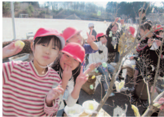
食べながら、繭玉を飾りました

かつて各家庭で行われていた繭玉はもち米でつくる飾りで、毎年1月14日にヤマボウシの木の枝に飾り付け、自宅の大黒柱に縛るなどして豊作と健康を祈願していました。