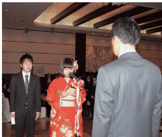
新成人代表による誓いの言葉