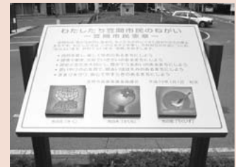
市民憲章碑(笠間駅)