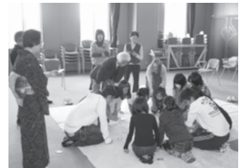
<小倉百人一首大会の様子>