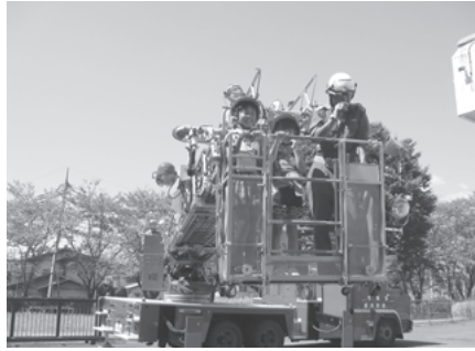
消防体験の様子（はしご車搭乗体験中）

市内の小学生を対象に物づくり・おもしろ理科先生・移動学習等を行う体験型の教室です。毎回、各小学校から集まった子どもたちが交流を深めながら、元気に楽しく活動しています。