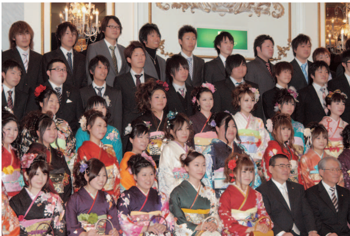
出身中学校区ごとに行われた記念撮影