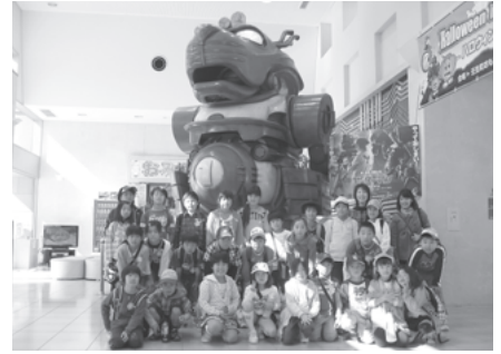
移動学習で壬生町おもちゃ博物館へ行きました