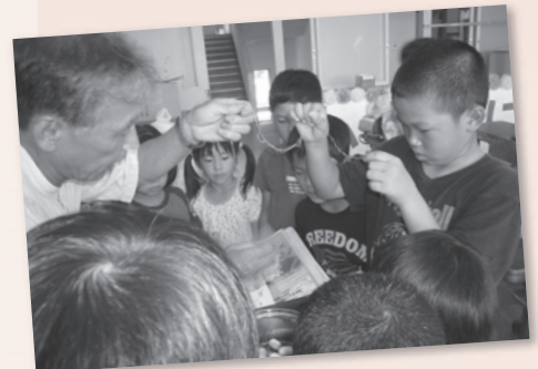
放課後子ども教室①まゆ糸つむぎ