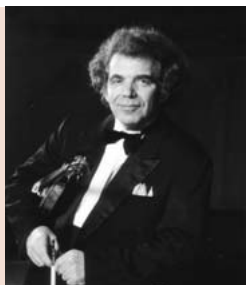
ザハール・ブロン

ザハール・ブロン ヴァイオリン・リサイタル 日時 3月21日(月・祝) 午後7時開演 会場 笠間公民館 大ホール 曲目 クライスラー名曲集:愛の喜びほか 料金 大人 1,500円 小中学生 1,000円