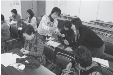
マフラー制作にチャレンジ

心のこもったマフラーはとてもあったかそうですね。プレゼントされる方がうらやましいです。