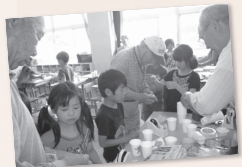
放課後子ども教室③作って遊ぼう