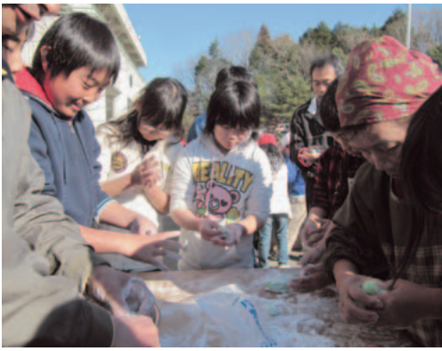
手で丸めて繭玉をつくりました

子どもたちは、阿久津さんらの指導を受けながら、きねと臼を使い1斗5升のもち米でもちをつき、手で丸めて繭玉をつくり、最後に赤・白・黄色・緑など華やかな色合いの繭玉をヤマボウシの木に飾り付け、繭玉飾りを完成させました。