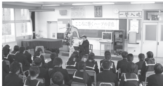
教室はあたたかい音色につつまれました