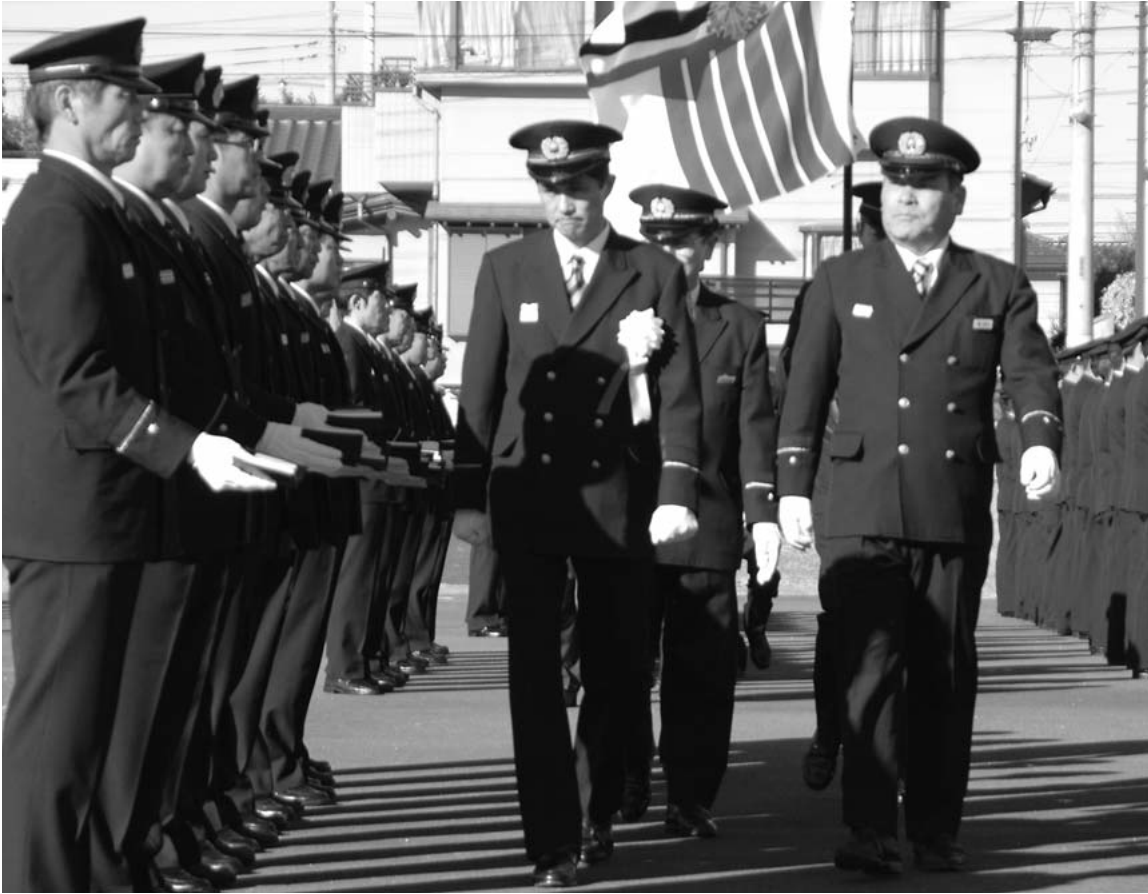
人員・姿勢および服装点検