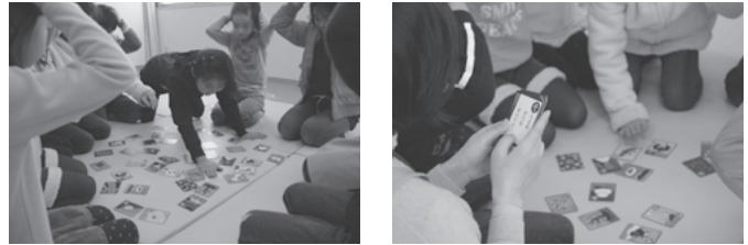
<かるた大会の様子>

毎年恒例のイベントなので、図書館のかるたで練習して、ぜひ来年も参加してくださいね。