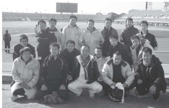
見事3位入賞を果たしたメンバー

見事な走りを見せたメンバーは、「来年もさらに上位を目指すとともに、市民の皆さんの生命・財産を守るため頑張っていきます。」と力強く語ってくれました。