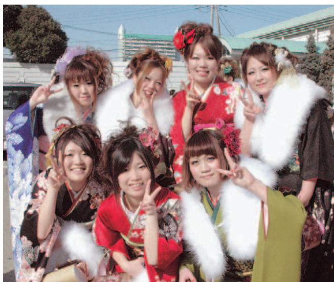
久しぶりに会った同級生たちと記念撮影