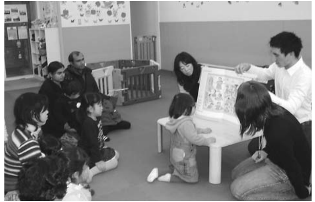
英語の絵本の読み語り会