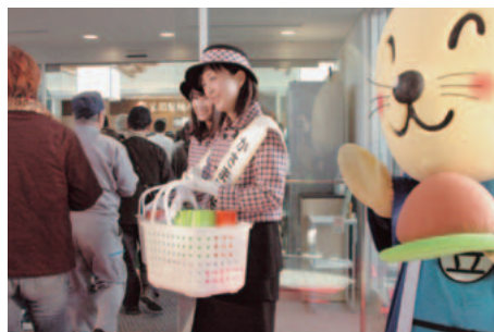
カサマテラスオープニングで記念品を配布する観光大使といなぎ

にオープンしました。また、同時に北関東自動車道初となるガステーション（24時間営業、セルフ式）がオープンしました。北関東自動車道は、今年3月19日、全線開通することになっており、東北自動車道や関越自動車道もつながるため、交流促進が大いに期待されています。