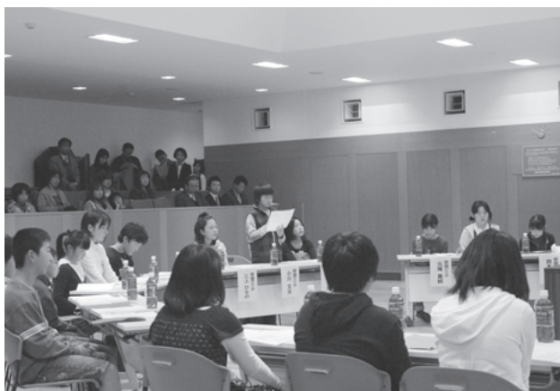
真剣な表情でミーティングに参加する児童たち

市長がひとつひとつそれらの質問に答えると、子どもたちは熱心にうなずいていました。