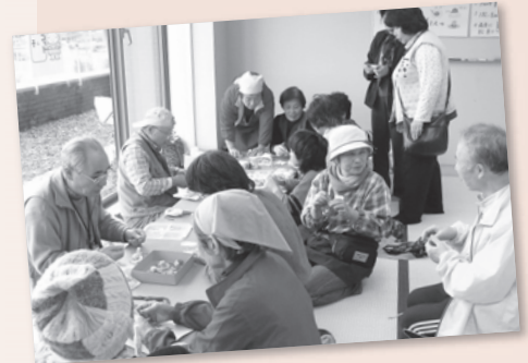
公民館まつり(こてんぐの広場)