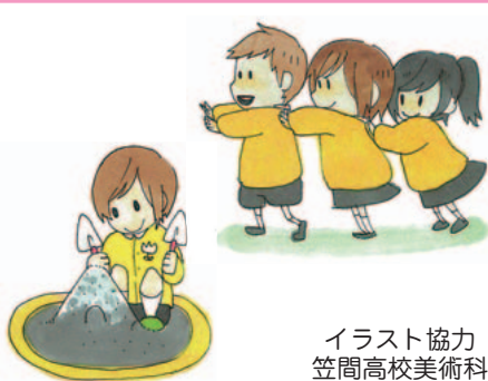
イラスト協力 笠間高校美術科