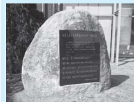
市民憲章碑 (市民センターいわま)