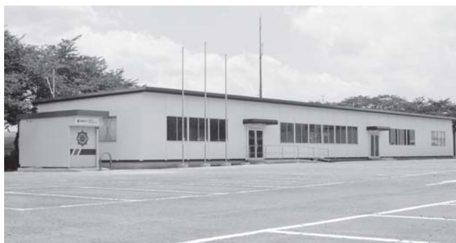
笠間支所仮設庁舎全景