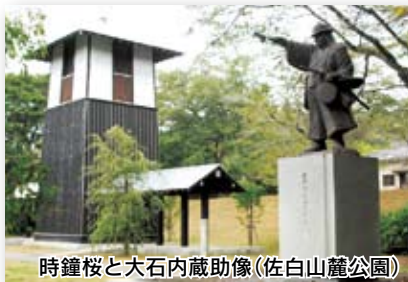
時鐘桜と大石内蔵助像(佐白山麓公園)