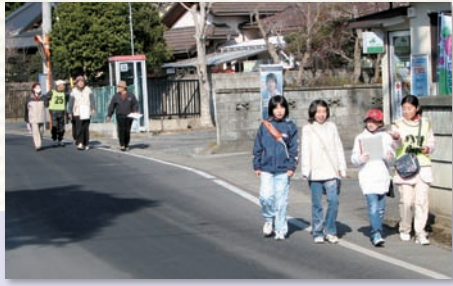
地図を片手に歩く参加者たち