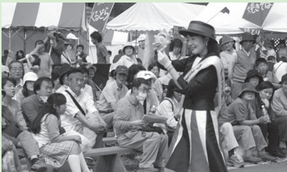
200人以上の陶芸家や窯元が出店する笠間焼最大のお祭り。土面のオークションやコンサート、人気の夜まつりなど、楽しいイベントも盛りだくさんで、毎年たくさんの方でにぎわいます。

笠間でとれた農産物や観光物産品を中心に、展示即売が行われます。 会期 ▼5月3日(※)・4日(※)午前9時～午後4時 会場 ▼大町公園通り駐車場 関大地の宴プロジェクト実行委員会 ☎0296(72)0284(石井)