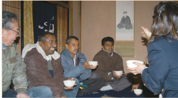
日本の伝統文化「茶の湯」を体験する研修生

JICA(国際協力機構)研修生のホームステイ協力や、ホームタウン観光通訳ガイド事業の展開など、さまざまな分野で国際交流に貢献する笠間市国際交流協会。3月4・5日の2日間、今年もJICA主催の外国人研修生を受け入れ、異文化の親交に一役買いました。 今回の研修生は、東南アジアやアフリカなどから訪れた男性7人。「茶の湯」を体験した後、市内4家族の協力で1泊2日のホームステイを行いました。互いの交流を深めました。