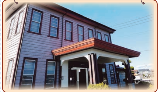
笠間クラインガルテン