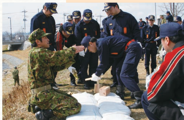
自衛隊の指導による初の災害対策訓練

3月5日、笠間シヨッピングセンター1階の亀ヶ橋北公園で、笠間地区消防団大雨対策研修会が行われました。 この研修会は、大雨に対する初動体制を確立し、分団相互の連携を強化しようといわれたもので、消防団本部と消防団員の総勢104人が参加しました。 指導にあたったのは、陸上自衛隊(ひたちなか市)から派遣された精鋭7人。水害を想定した状況報告訓練と水防工法研修の後、土のう積みの実技訓練が行われ、団員たちは、ふだん見ることでできない本格的な工法と機能性に、驚きと称賛の声を上げていました。