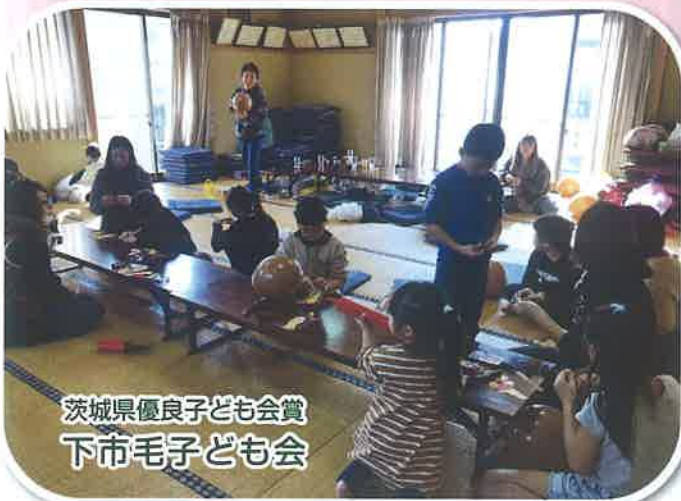
茨城県優良子ども会賞 下市毛子ども会