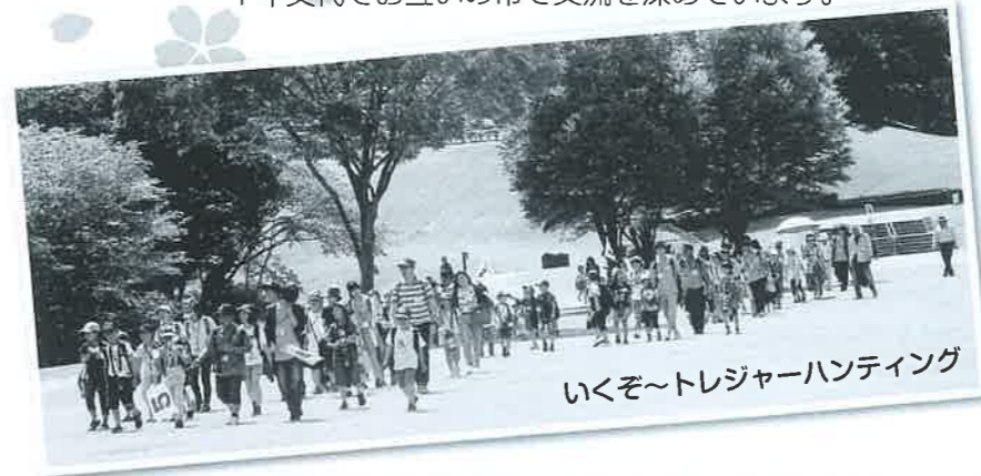
いくぞ〜トレジャーハンティング

※子ども会のトレジャーハンティングは、何カ所かのヒントカードを見つけ出し、そのヒントから、宝のありかを見つけ出しゲットするもの。