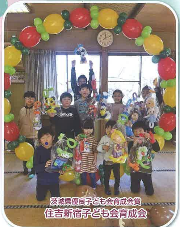
茨城県優良子ども会育成会賞 住吉新宿子ども会育成会

日頃より、笠間市子ども会育成連合会の活動にご理解とご協力を頂き、厚く御礼申し上げます。 令和3年度も総会に加えて六つの事業を予定していたところ、新型コロナウイルス感染症拡大の影響で、事業の開催をすることができませんでしたが、皆様のご理解とご協力で夏休み作品コンクールを北山公園管理棟内で開催、展示することができました。厚く御礼申し上げます。 今年度、本会では、高校生会をはじめ地域の担い手となっていけるようなジュニアリーダーの育成にも力を入れて活動してまいりましたが、少子高齢化が進む中、年々会員数の減少に歯止めがかからない状況が続いており、子ども会活動に大きな影響を与えています。今後は少子化に対応した組織作りが必要とされます。 そこで、令和3年度の総会にて、小学校単位で構成していた支部を、小学校・中学校・義務教育学校で構成していくことを提案し、会則の一部変更を承認いただきました。このことにつきまして、会員の皆様のご理解とご支援、ご協力を今後ともよろしくお願いいたします。 また、今後も子ども会事業をとおして、子どもたちにいろいろな体験と元気な笑顔がたくさん見ることができましますように、事業の継続・見直しをしながら進めていきたいと思っておりますので、重ねて子ども会活動へのご理解とご協力をお願いいたします。