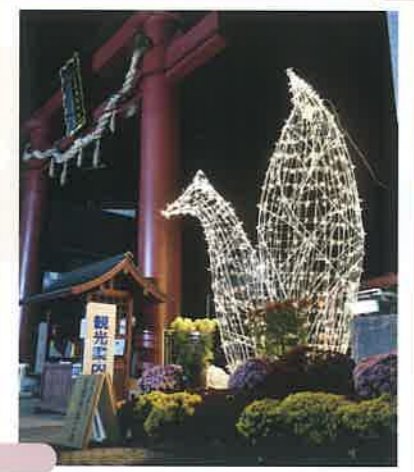
菊まつり期間中限定!思わず写真を撮りたくなるフォトスポットになります。