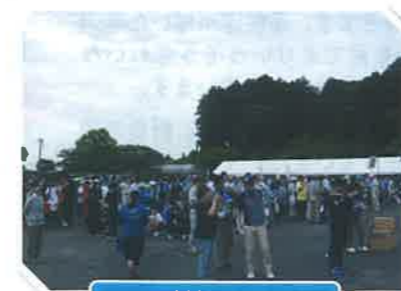
ひぬま流域クリーン作戦

「ひぬま流域ウォッチング」や「環境フォーラム」は、小さなお子様でも参加できる内容となっております。会員になって、御家族・御友達と自然に触れながら、環境保全活動に取り組んでみませんか。