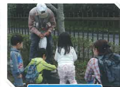
ひぬま流域ウォッチング