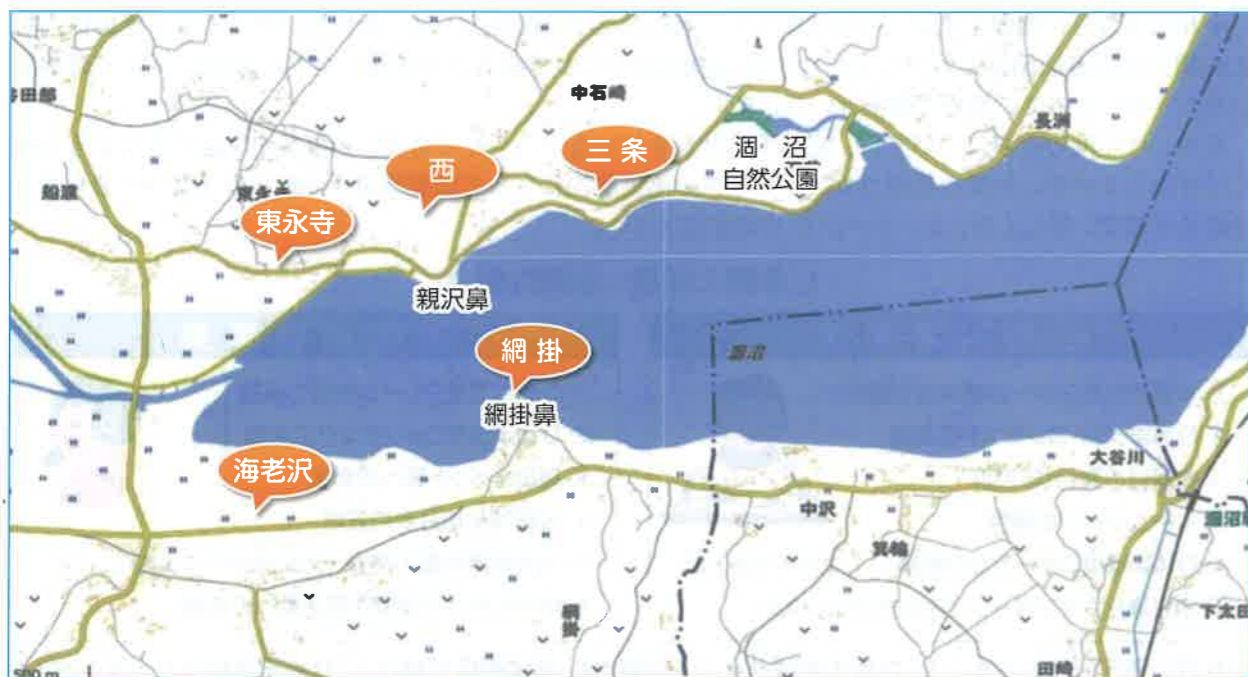
オオワシが目撃されているポイント(地図:国土地理院より)