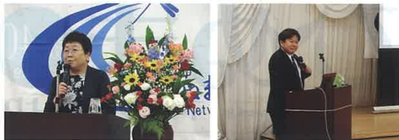
令和元年度定期総会