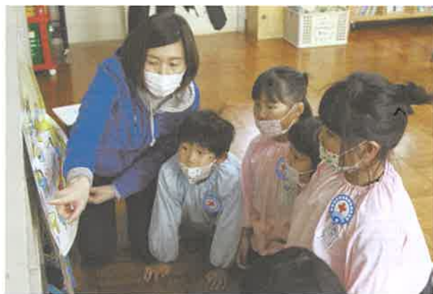
「まちがいさがし」で身を守る方法を学ぶ子どもたち (太子町立太子幼稚園)