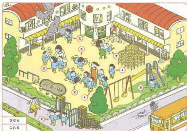
幼稚園・保育所の子どもたちが楽しく学べる防災教材

また、いざという時に自分自身や家族などのいのちを守ることができるよう、県民の方を対象に「防災セミナー」を実施し、地域における「自助」と「共助」の力を高めます。