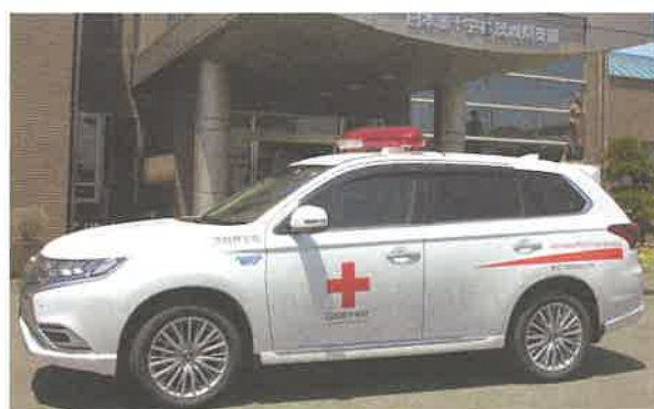
被災地で電源供給が可能な車両