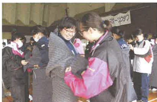
防災訓練での健康生活支援講習 (毛布を使ったガウン作り)