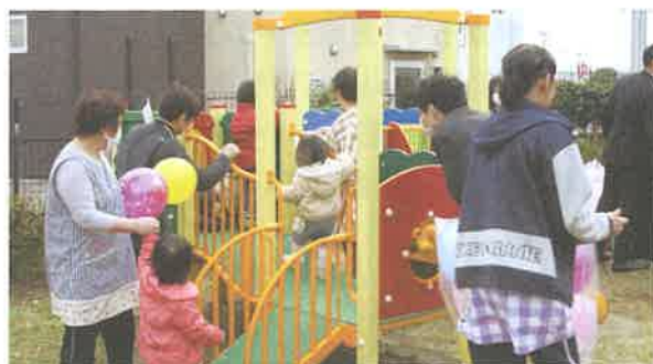
子どもたちの健やかな成長を支える遊具