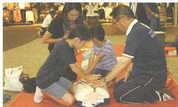
イベントでの救急法講習 (心肺蘇生)

平成30年度は、県内各地で実施されたイベント会場に体験コーナーを設けるなど、救急法などの講習を505回実施し、約2万人の方に学んでいただきました。