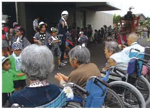
子どもみこしとお年寄との交流

つ、福祉の役割を担い、地域 社会の向上に努め、大過なく 任務を遂行することが出来ま した。これもひとえに、市社 協、区長、支部会員、女性部、 役員の皆様方のご協力とご支 援の賜物と厚く御礼申し上げます。 今後も、関わりさせて頂 く事が有るかと思えます。最 後になりましたが、東支部社 協の益々の発展と、支部の皆 様には、健康に留意され、ご 活躍されます事を心よりご祈 念申し上げます。長い間有り難うござ いました。