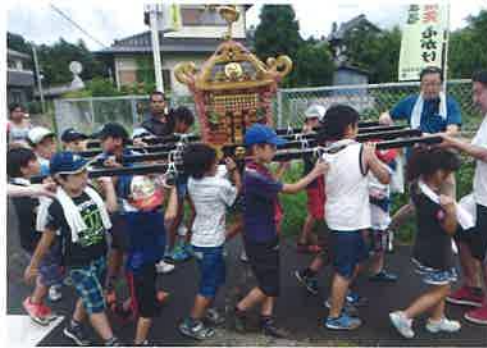
ワッショイ!ワッショイ!

7月30日に高房神社祇園祭 で子どもみこしが町内を巡行 しました。みこしは子ども21 名、保護者20名でかつぎまし た。途中数箇所の休憩所で歓 待を受けました。