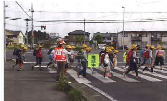
友小通学路の立哨 (ファミリーマート角交差点)

東支部では、小中学生の通学時間に合わせて立哨活動を行います。毎月第2火曜日に地域内8箇所を実施し、支部役員と女性部員が各箇所2〜4名で担当しています。