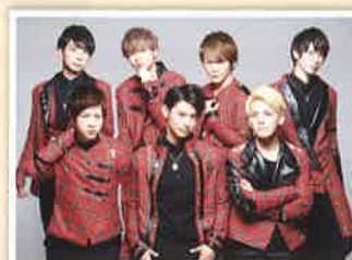
NEVA GIVE UP