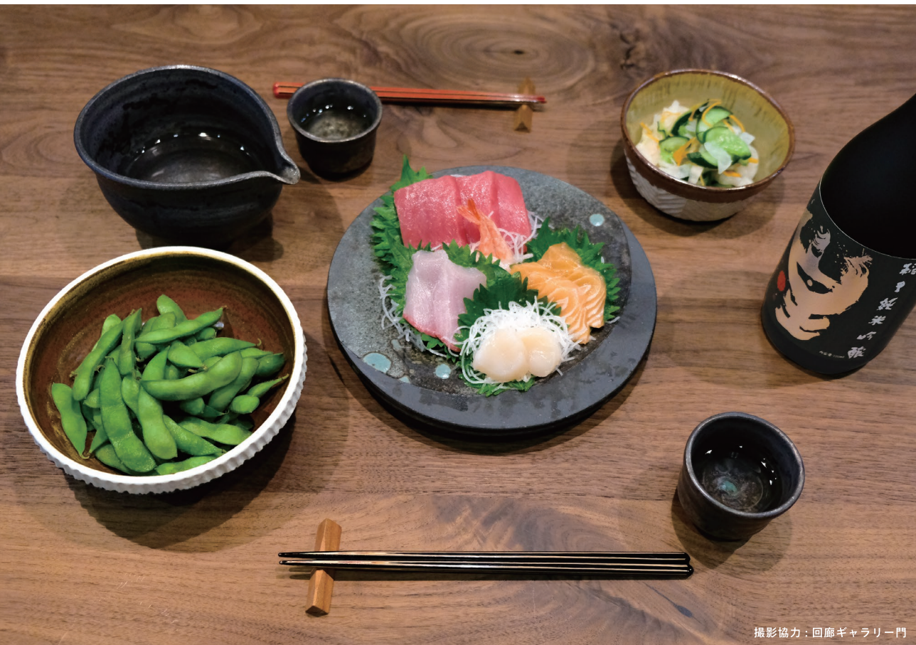
撮影協力：回廊ギャラリー一門

今日もがんばった、おつかれさま。笠間焼のぐい呑みに、笠間の地酒を注いで、静かにかんばい。 肴をつまんでお酒を酌み交わせば、会話がはずむし、笑顔も増える。 「ねえ、今日はどんな日だった?」「明日もいいこと、あるといいね。」 今日を走り抜け、明日へと向かう。心と体をねぎらうひととき。