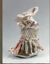
大賞・桂宮賜杯 井上 雅之「NT-171」2017年

◆企画展「第24回 日本陶芸展」 6/17(土)～9/3(日) 本展は隔年で開催される公募展で「実力日本一の陶芸作家を選ぶ」とのコンセプトのもと、現代日本トップレベルの作品が一堂に会します。公募部門に現代の巨匠が出品する招待部門を加えた計150点の作品を展示します。 料/一般720(570)円、高大生510(410)円、小中生260(210)円 ※( )内は20名以上の団体料金 ◆コレクション展「新収蔵品展」 料/企画展チケットで観覧可 第1展示室 6/6(火)～10/9(月・祝) 第2展示室 6/21(水)～10/15(日) ◆第17回全国こども陶芸展 in かさま 料/入場無料 7/28(金)～8/31(木) 開/9:30～17:00(入場は16:30) 休/毎週月曜(但し祝日は開館し、翌日休館)