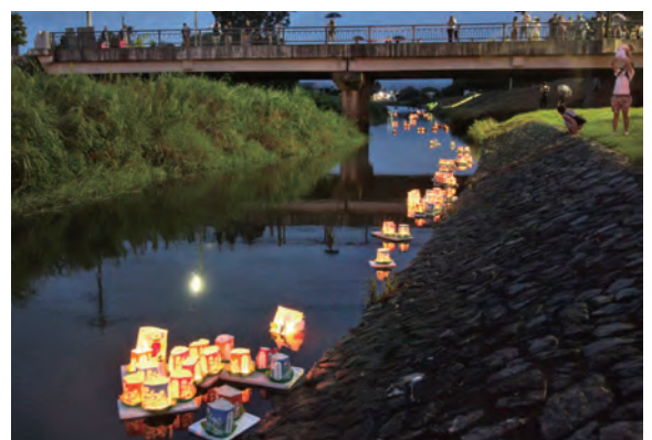
表紙写真／(左段) ピオトープ 天神の里 (右段・上から) NPO法人 稲田en日 浴衣の女性が歩く笠間稲荷神社(※1) 灯籠流しが行われる酒沼川(※2) フォトコンテスト応募作品より(敬称略 ※1「献灯祭の夕べ」高田良昇 ※2「灯籠流し」佐海忠夫)

笠間特別観光大使 NEVA GIVE UP 夏のイベント情報 笠間再発見! NPO法人 稲田en日