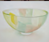
貴島雄太郎作品 Glass Gallery SUMITO