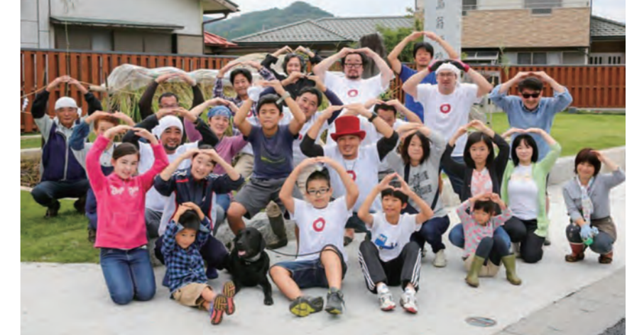
メンバーで記念撮影。一緒に盛り上げてくれる仲間を募集中です！

稲田石の産地として知られる笠間の稲田地区。稲田の魅力をたくさんの人に知ってもらいたい！ということで、石材業を営む若手経営者を中心に結成されたのがNPO法人『稲田en日』です。イベントへの参加やボランティア活動など、元気いっぱいの活動内容をレポートします！