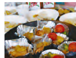
とりあえずやってみよう! 大試食会(*^v^*)