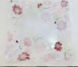
小浜恵子作品 Glass Gallery SUMITO