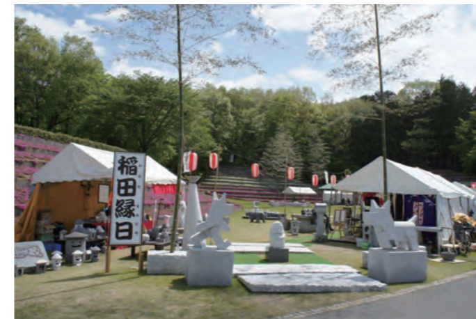
陶炎祭(ひまつり)会場に設けられた『稲田縁日』エリア