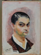
モイーズ・キスリング「自画像」

◆企画展「カンヴァスの中の巨匠たち Self-Portraits by Painters」 5/27(土)～7/30(日) 古くから画家は自画像を描いてきました。鏡の中の顔を見つめ、心の中で対話しながら描かれた自画像は単なる肖像画ではなく、自ずと精神性が表れたものであるはず。絵を描く職業ならではの、究極の自己表現が自画像といえましょう。笠間日動美術館所蔵の自画像コレクションより約60作家を取り上げ、絵画作品も合わせ展示します。 〈主な出品作家〉モイーズ・キスリング/マルク・シャガール/パブロ・ピカソ/相笠昌義/入江 観/梅原龍三郎/奥谷 博/鴨居 玲/北川民次/城戸義郎/佐伯祐三/中川一政/林 武/藤田嗣治/宮本三郎/開 光市/安井曾太郎ほか 開/9:30～17:00(入館受付は16:30まで) 休/毎週月曜日(但し7/17は開館、7/18は休館) 料/大人1000円、65歳以上800円、大学・高校生700円、中学以下無料、春風萬里荘(北大路魯山人旧居)との共通券/大人1400円、65歳以上1100円、大学・高校生900円、中学以下無料、※20名以上の団体は各200円割引 ※障がい者手帳をお持ちの方および同伴者1名は各半額割引 (会期中のイベント) ●ギャラリートーク 6/10(土)、7/8(土)、7/23(日) 各日 14:00～14:30