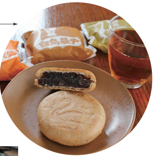
55年前に発売された『白鳥最中』

《製造元・お問い合わせ》 岡田屋 住/笠間市中央3-1-2 tel/0296-77-0255 営/8:30～16:30 休/日曜日