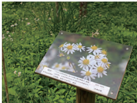
案内板のおかげで植物の名前等がすぐに分かります