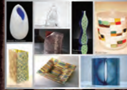
飾る・楽しむガラス Glass Gallery SUMITO