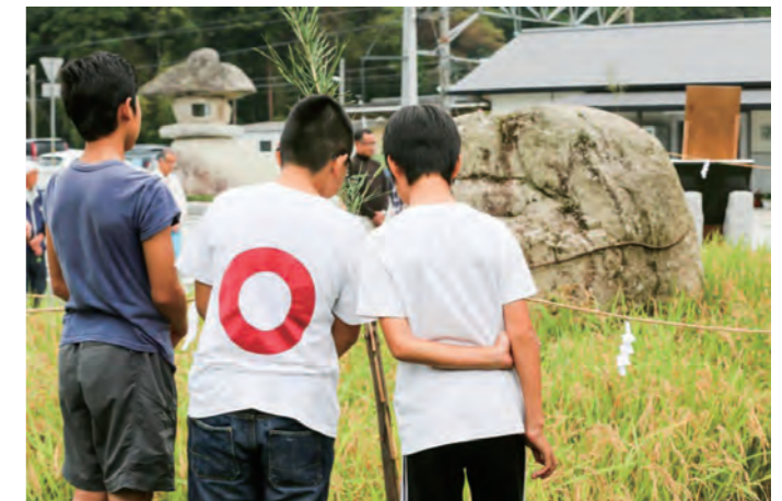
背中の〇は『稲田en日』のロゴマーク