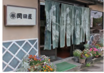
落ち着いた店構え