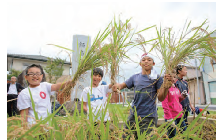
稲刈りは楽しい！刈り取った稲は「おだかけ」で天日干しにします