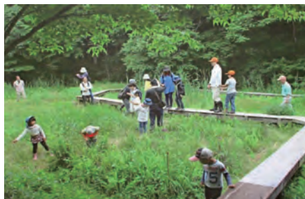
自然観察会などのイベントも開催されます

す。里内には山林や湿地帯、池などがあって、ホタルやトンボ、チョウなどの昆虫や200種類を超える植物が自生。それらを写真で紹介する案内板が120枚も設置されているので、名前や特徴がすぐに分かって便利です。釣り大会や自然鑑賞会などのイベントも積極的に行われ、毎月第1日曜日(1月・5月は第2日曜日、6月から9月は第3土曜日も活動)の午前中は、草刈などのボランティア作業が行われています。興味がある人はお手伝い歓迎です。ビオトープの場所は北山公園の管理事務所を目指すとは分かりやすいですよ。