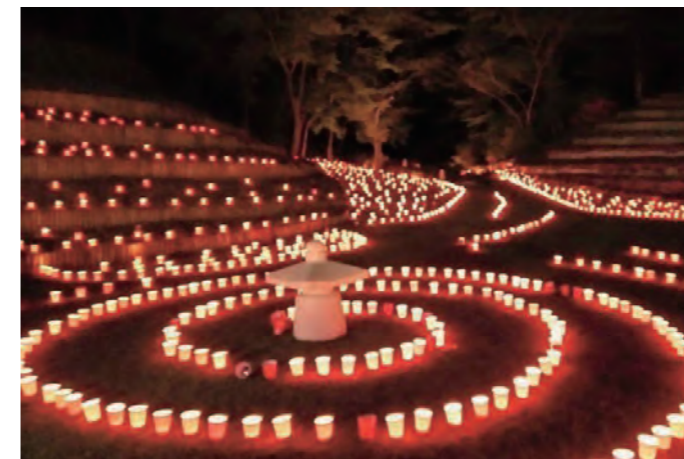
幻想的な美しさのキャンドルナイトで稲田石をPR