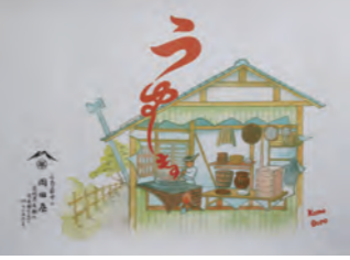
包装紙の絵は店主自らが描いたもの