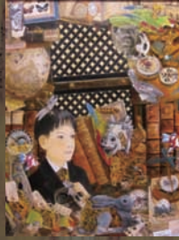
渡邊 榮一「少年王国」 〈自画像を描くということは、おのずから潜在的に潜む眼球から情緒への移項をいみする〉

◆ 画家の夢と世界の児童画 8/21(木)~9/28(日) 世界の児童の描いた「夢」にあふれた絵画作品には、大人たちの遠い日と呼び戻す豊かな力があります。そして画家の描いた世界には、人間としての普遍的「夢」が深く染み込んでいます。子供時代にその「夢」を深化させ、描き続けた画家たちの作品31点を、世界の児童画とともに展示。 ◆ 茅葺き民家を追い求めて 向井潤吉展 10/2(木)~12/7(日) 向井潤吉(1901-1995)は自然の豊饒さに魅せられ、日本の民家、そして風土を、半生をかけて取材し描き続けました。その真摯な作品は、観るものに自然の尊さ、風物の美しさを教えてくれます。茅葺き民家に焦点をあてた油彩画約60点、水彩画約30点により向井潤吉の画業を紹介。 【会期中のイベント】 ● 講演会 講師：世田谷美術館美術課長 橋本善八 開催日時未定 ● 宗次郎 オカリナコンサート 10/12(日) 18時開演 ● プチコンサート 各日14:00~15:00 ● 1日画家体験「ジョルジュ・スーラ」11/8(土) 10:00~15:00 定員30名(要予約) ● 水彩・パステル基礎講座 10/11(土)・11/15(土) 10:00~15:00 定員30名(要予約) 開/9:30~17:00(入館受付は16:30まで) 休/毎週月曜日(ただし、祝日の場合は開館し翌日休館) 料/大人1000円、大学・高校生700円、中学・小学生300円、65歳以上800円(20名以上の団体は各200円割引) 春風萬里荘(北大路魯山人旧居)との共通券/大人1400円、大学・高校生900円、中学・小学生400円、65歳以上1100円(20名以上の団体は各200円割引)