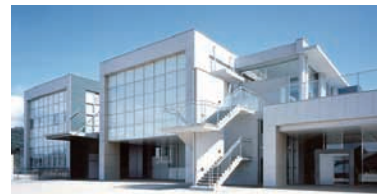
茨城県陶芸美術館