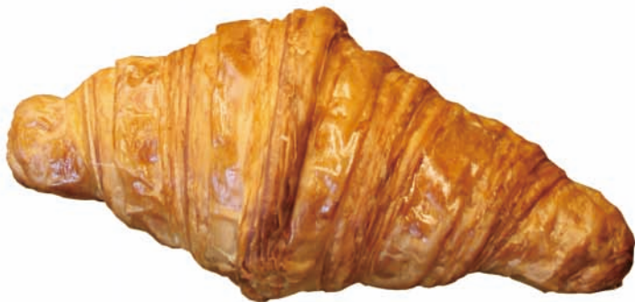
ザクツとした食感で人気のクロワッサン・オ・ブール