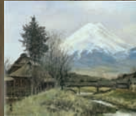
春陽富士 (山梨県南都留郡忍野村忍草) 1965年 向井潤吉アトリエ館 寄託 ©Mieko Mukai 2014 (笠間日動美術館)