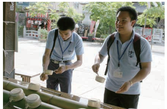
表紙写真（上段）秋の笠間芸術の森公園、神事 流鏝馬（やぶさめ）、（下段）笠間浪漫、門前通りの商店、笠間稻荷神社を参拝する外国人研修員