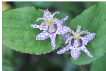
ヤマジノホトトギス