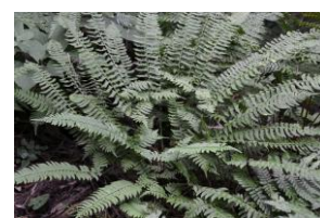
ジュウモンジシダ