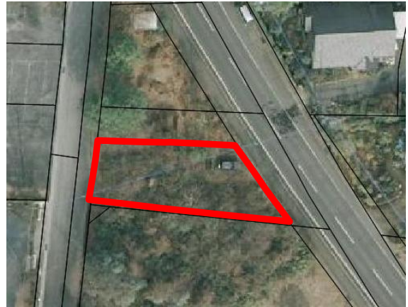
写真②(航空写真より)