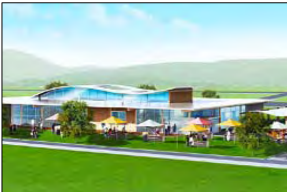
地域交流センター【イメージ図】