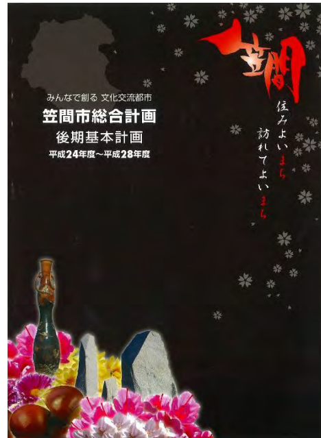
笠間市総合計画 (後期基本計画)

笠間市では、約322億円の合併特例債の活用が可能ですが、合併協議会においてこれをすべて活用するのではなく、新しい笠間市の総合計画に基づいた事業で、市の一体性を高めたり、均衡ある発展や住民福祉の向上を実現するため特に必要な事業のうち、真に必要なものを厳選し活用することとしました。