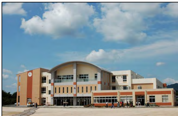
岩間中学校の新校舎