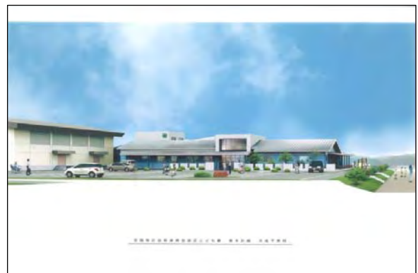
認定こども園【イメージ図】