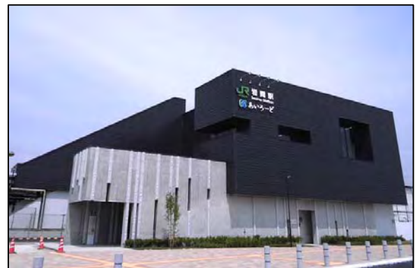
岩間駅駅舎・自由通路