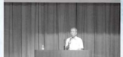
自らの戦争体験談について講演する丹さん