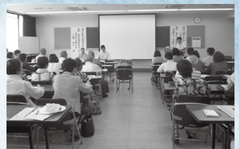
熱心に聞き入る市民

成年後見制度を利用することや笠間市の特徴的な詐欺被害を学び、トラブルへの対処に役立つとても有意義な講演会となりました。