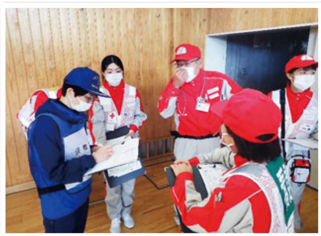
避難所の保健師との情報共有