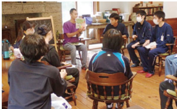
学院のスタッフから海外の文化を学ぶ