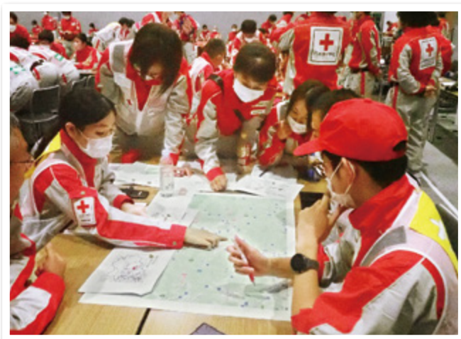
避難所までのアクセス確認

茨城県支部では、本県内で実際に災害が発生した時に、迅速かつ適切な救護活動が行えるよう、定期的に訓練を行っているほか医療資機材の整備も進めています。