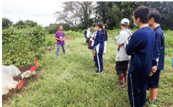
有機農業について説明を受ける

9月23日、北関東三県（茨城、栃木、群馬）支部合同の国際交流事業の一環として、各県の高校生メンバー27人と指導者5人（茨城からメンバー4人、指導者1人が参加）が栃木県那須塩原市にある「学校法人 アジア学院」を訪問しました。