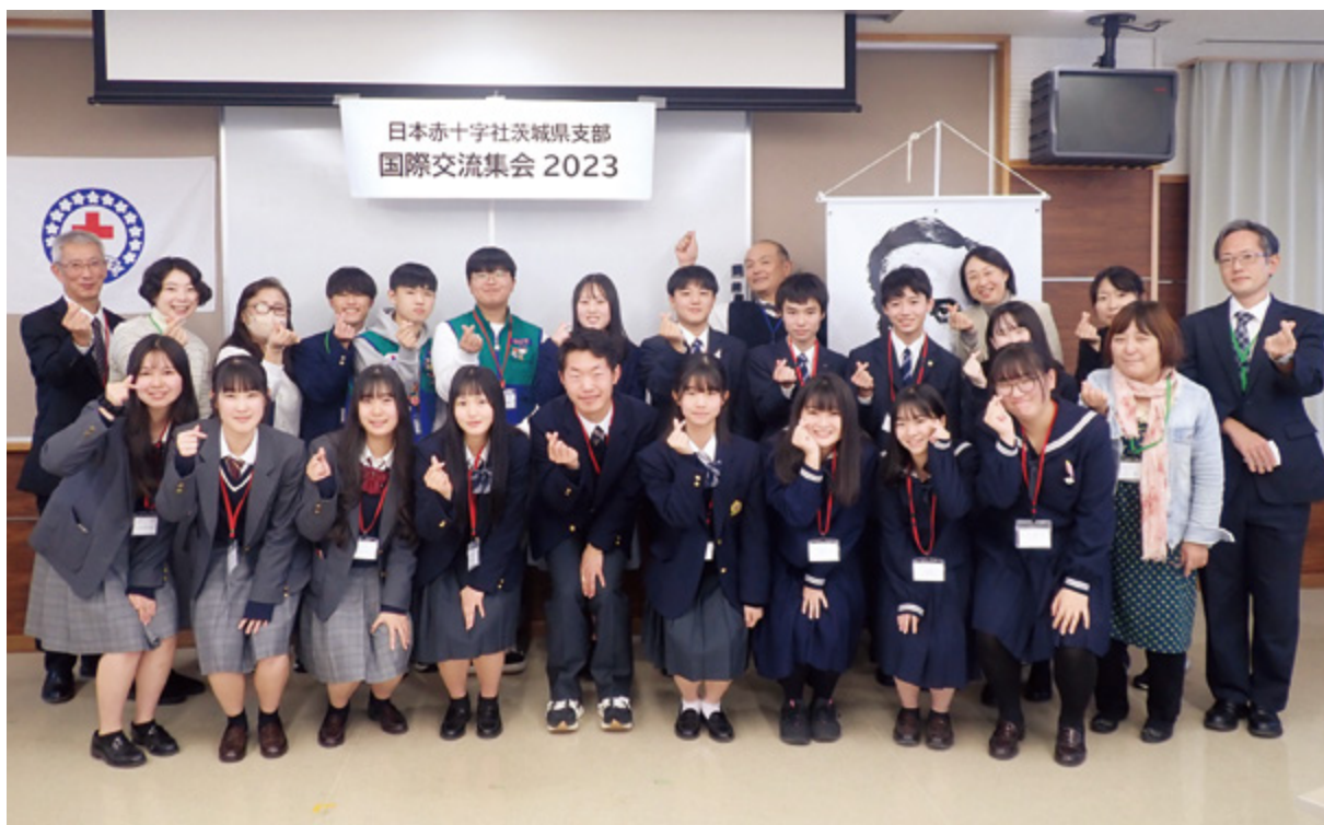
韓国の青少年赤十字（JRC）メンバーと国際親善

11月18日から22日までの5日間、大韓赤十字社(韓国)の青少年赤十字メンバー2名が当県を訪れ、青少年赤十字メンバーとの交流集会や、茨城高等学校と水戸桜ノ牧高等学校での1日体験学習に参加するとともに、青少年赤十字メンバー宅でのホームステイを行いました。