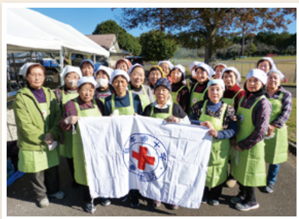
かすみがうら市地域奉仕団の皆さん

私たち奉仕団は、災害や有事の際に地域内で助け合う活動をしております。市の総合防災訓練を前に日赤茨城県支部の職員にご支援をいただき災害用炊飯袋を使用した非常食の手順を再確認しました。防災訓練当日も手際よく奉仕団一人ひとりが役割を理解し実施することができました。人と人との交流が戻ってきましたので、これからも他団体と連携を図りながら地域ニーズに応じた活動に取り組んでまいります。