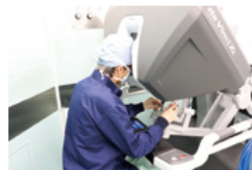
遠隔操作する医師