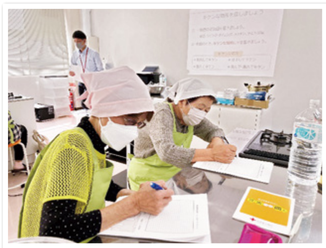
自宅内の危険な場所を確認