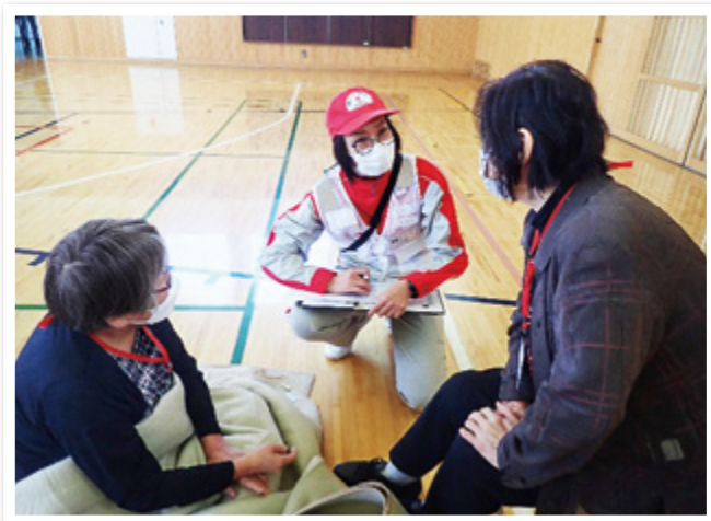
避難者への声かけ