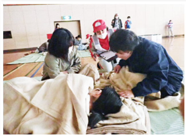
体調が悪い方への聞き取り