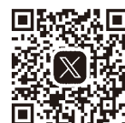
つくば献血ルーム公式SNS