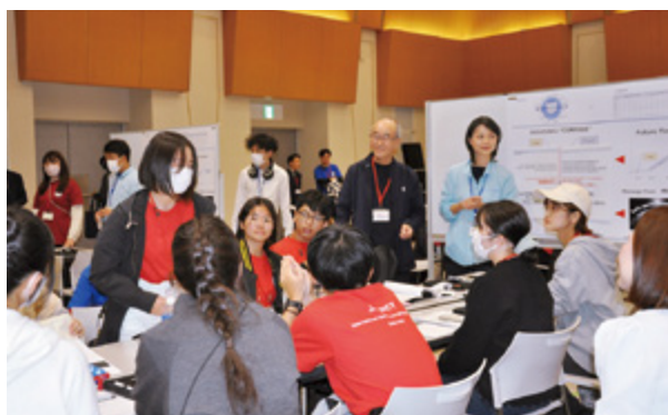
気候変動についてディスカッションするメンバー