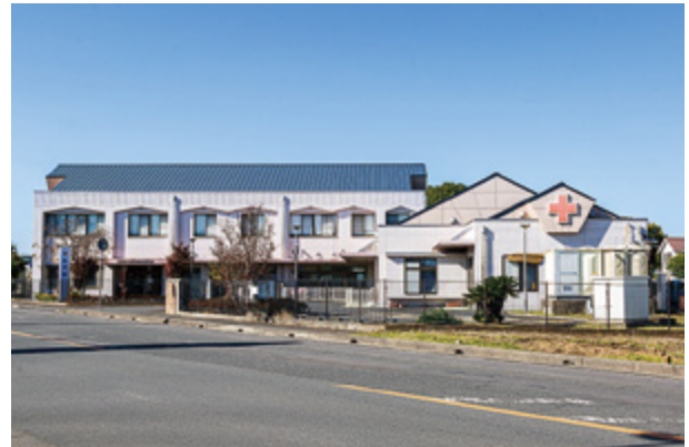
日本赤十字茨城県支部乳児院