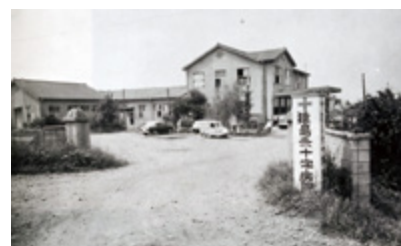
創設当時の古河(猿島)赤十字病院 昭和28年