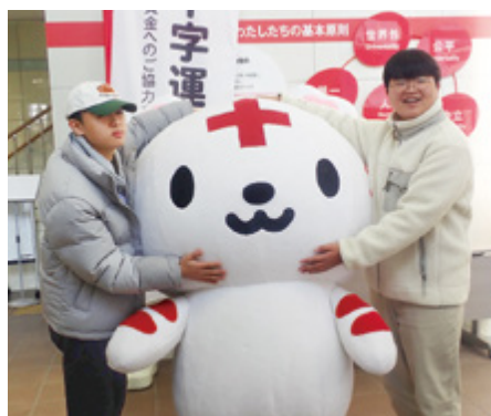
韓国メンバーとハートラちゃん