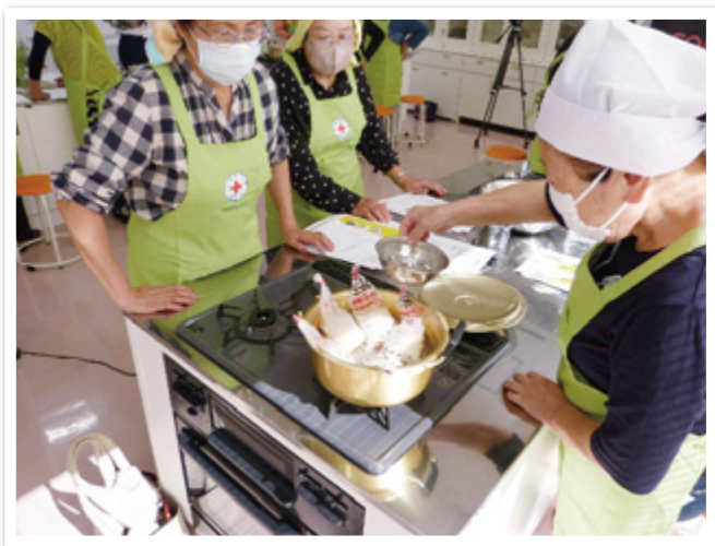
災害用炊飯袋を用いた炊き出し訓練