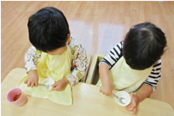
こぼしても大丈夫。たくさん食べて大きく育てね