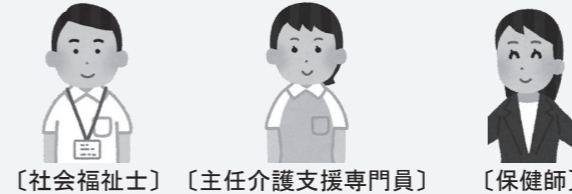
〔社会福祉士〕 〔主任介護支援専門員〕 〔保健師〕