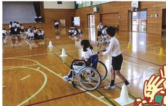
小学生のみなさんがさまざまな福祉用具を使った体験を行いました

ボランティアに関する相談や、活動への助成を行っています。 ボランティア活動を希望される方は、お住まいの市町村社協または県社協にお問い合わせください。 また、福祉体験用に、器材等の貸し出しを行っています。 貸し出し物品は、県社協ホームページをご覧ください。