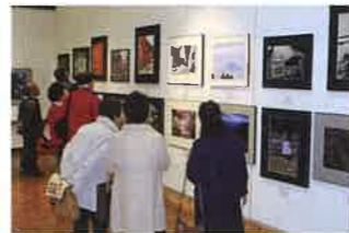
展覧会は多くの方でにぎわいました 平成29年度茨城県知事賞(日本画)

シニア世代の芸術の祭典「わくわく美術展」を開催します。 日本画・洋画・彫刻・工芸・書・写真の分野の作品を募集し、入選作品を展示します。