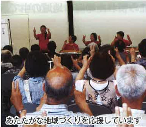
あたたかな地域づくりを応援しています