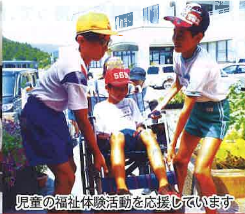
児童の福祉体験活動を応援しています