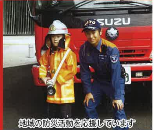
地域の防災活動を応援しています