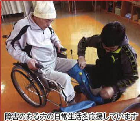
障害のある方の日常生活を応援しています