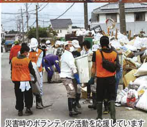
災害時のボランティア活動を応援しています