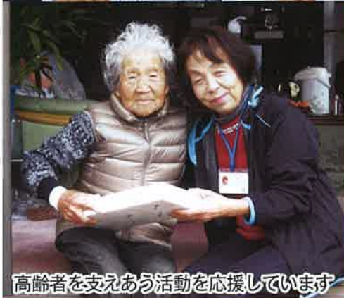
高齢者を支えあう活動を応援しています

共同募金は法律にもとづいて全国一斉に行われる民間最大の募金活動です。事前に使いみちや集める額(目標)を定め、地域の福祉のための、募金と助成に関する計画を立てる募金です。さらに、目標額や助成結果を公表することが義務づけられています。