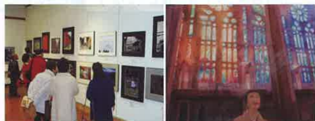
平成29年度茨城県知事賞受賞作品(洋画)

シニア世代の芸術の祭典「わくわく美術展」を開催します。日本画・洋画など絵画全般をはじめ、書・写真・彫刻などを含めた幅広い分野の作品を募集し、入選作品を展示します。