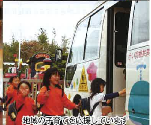
地域の子育てを応援しています